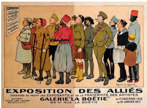
Affiche tirée de l'exposition | consacrée aux affiches militaires et représentant une affiche invitant à visiter une exposition consacrée aux alliés en 1916

Cette exposition présente à travers une partie des collections d'affiches du SHD les relations entre Armée et Nation du XVIII e siècle à nos jours. Dans le cadre des expositions, une action pédagogique spécifique est mise en place à destination des enseignants, des scolaires et des familles.