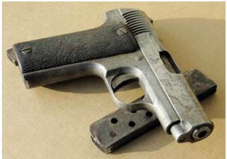
Musée de la Résistance nationale (Val-de-Marne)