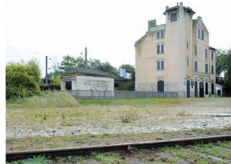
Ancienne gare de déportation (Seine-Saint-Denis)