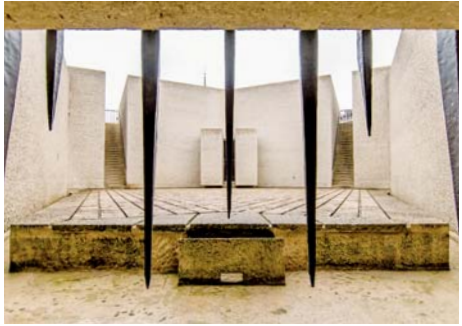
Mémorial des martyrs de la Déportation Île de la Cité (Paris 4 e )