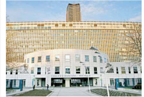
Musée Général Leclerc, Musée Jean Moulin Paris Musées (Paris 14 e )