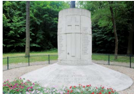
Monument des fusillés (Bois de Boulogne)