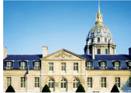
Musée de l'Ordre de la Libération Hôtel national des Invalides (Paris 7 e )