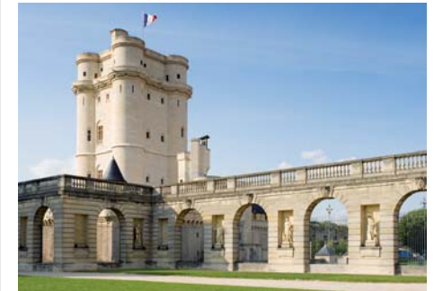
Château de Vincennes (Val-de-Marne)