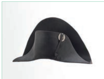
Chapeau porté par Napoléon I er pendant la Campagne de Russie, Poupard et Delaunay, Chapeliers au Palais-Royal

Des outils multimédia spécialement conçus pour l'exposition, proposeront une approche immersive qui permettra au visiteur de s'approprier des notions souvent abstraites. En écho, celui-ci trouvera dans les salles permanentes toutes proches, de nouveaux dispositifs qui leur répondent en incarnant, suivant le fil de sa carrière, les conceptions stratégiques de Napoléon I er .