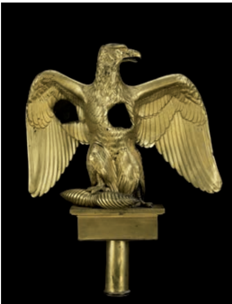
Aigle «blessée», modèle 1811

Quoique généralement décrit comme un génie victorieux, Napoléon a pourtant été vaincu sur le champ de bataille. Afin de résoudre ce paradoxe, le parcours de visite renverse ensuite la perspective. On y suivra ceux qu'il a affrontés, battus et à qui il a, indirectement, enseigné l'art de la guerre. Ce renversement de perspective met en relief les points faibles du dispositif napoléonien, et la marche de l'histoire.