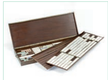
Cassette utilisée par Napoléon I er, contenant l'ordre des batailles des armées autrichiennes d'Italie et d'Allemagne en 1805, Martin-Guillaume Biennais (1764-1843), orfèvre