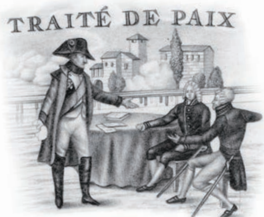
Illustrations pour l'affiche Napoléon stratège © Violaine et Jérémy

Dans le cadre de la prochaine exposition Napoléon stratège , l'Écho du Dôme a demandé à Martin Motte comment penser la stratégie aujourd'hui.