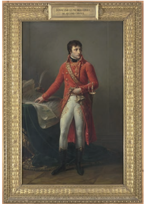
Bonaparte 1 er consul, Antoine-Jean Gros, baron (1771-1835)