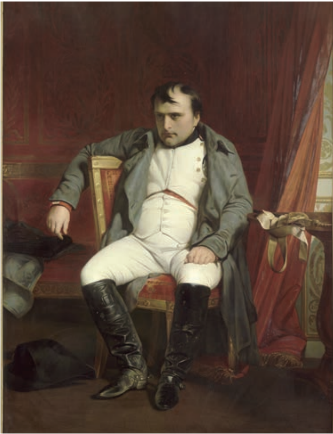
Napoléon à Fontainebleau, le 31 mars 1814, Paul Delaroche (1797-1856)