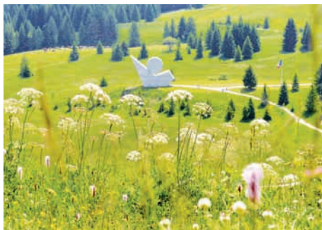
Monument des Glières (Haute-Savoie)