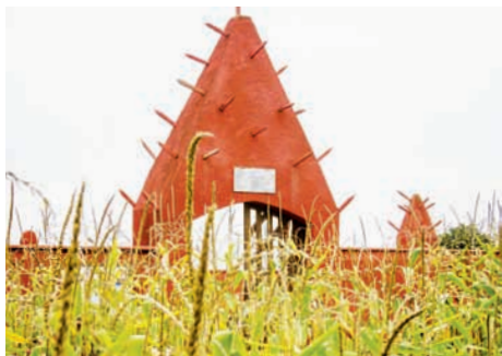
Nécropole nationale du Tata sénégalais (Rhône)