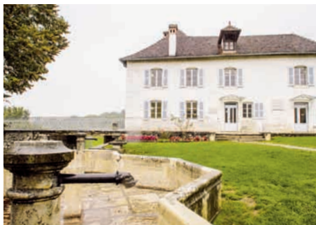
Maison d'Izieu (Ain)