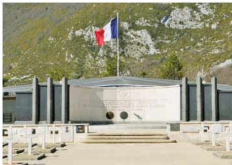
Nécropole nationale de la Résistance (Drôme)