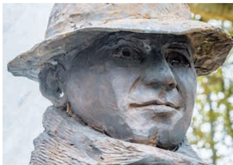
Mémorial Caluire - Jean Moulin (Rhône)