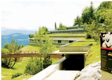
Mémorial de la Résistance en Vercors (Drôme)