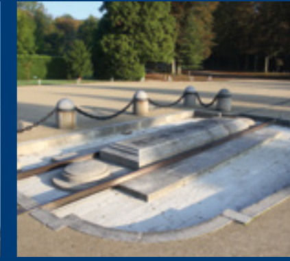
— Clairière de Rethondes