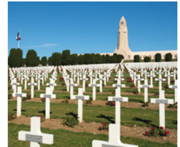
— Ossuaire et nécropole de Douaumont, CDT Meuse © Guillaume Ramon

— Clemenceau sur le front de la Somme en octobre 1916 © ECPAD / France / 1916 / Mas, Emmanuel