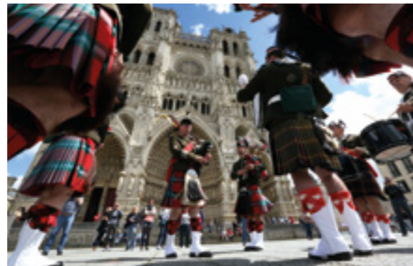
— Cérémonie devant la cathédrale d'Amiens, Fred Douchet © Le Courrier picard

— AD Arch. départ. Alpes-de-Haute-Provence, 61 Fi 4024, fonds Désiré Sic © Colin Miegue