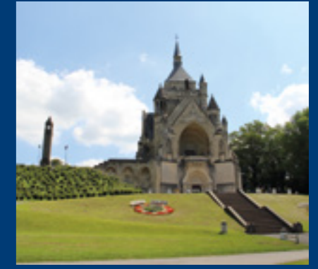
— Mémorial national des batailles de la Marne à Dormans