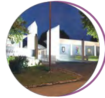
Musée-mémorial des parachutistes Pau