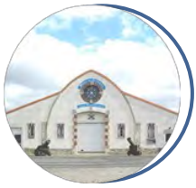
Musée du Matériel et de la Maintenance Bourges