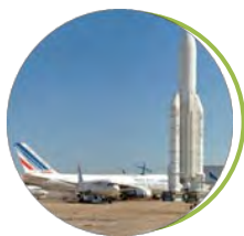
Musée de l'Air et de l'Espace Aéroport Paris Le Bourget