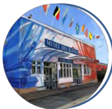
Musée des Blindés Saumur