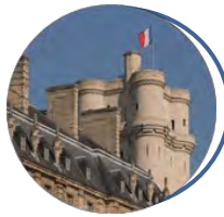
Service historique de la Défense Vincennes