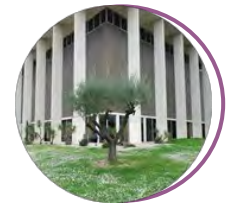
Musée de l'Artillerie Salle d'honneur de l'Infanterie Draguignan