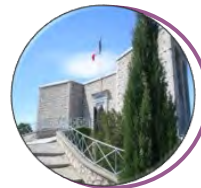
Mémorial du Mont Faron 8488 Route du Faron 83200 Toulon www.cheminsdememoire.gouv.fr