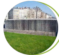
Mémorial des Martyrs de la Déportation Square de l'Île de France 75004 Paris www.cheminsdememoire.gouv.fr

Les neuf hauts lieux de la mémoire nationale, propriété de l'État, sont placés sous la responsabilité du ministère des armées. Ils relèvent de la Direction des patrimoines, de la mémoire et des archives (DPMA). Ces sites perpétuent la mémoire des conflits contemporains, depuis 1870 jusqu'à nos jours. Chaque haut lieu est emblématique d'un aspect de ces conflits. Tous marquent la volonté de l'État d'honorer ceux qui ont combattu pour la France ou qui ont été victimes des conflits dans lesquels elle a été engagée.