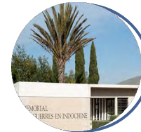
Mémorial des guerres en Indochine 862 Avenue du Général Callies 83600 Fréjus www.cheminsdememoire.gouv.fr