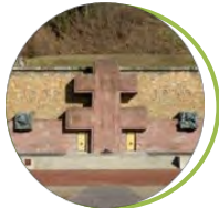
Le Mont-Valérien Avenue du Professeur Léon Bernard 92150 Suresnes www.mont-valerien.fr