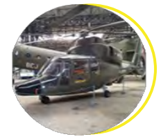
Musée de l'ALAT et de l'hélicoptère Dax