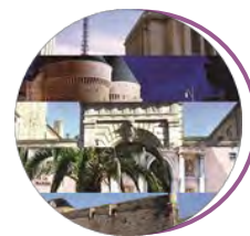
Musée national de la Marine Paris*, Brest, Port-Louis, Toulon, Rochefort (Hôtel de Cheusses et École de Médecine Navale)