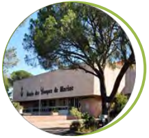
Musée des Troupes de marine Fréjus