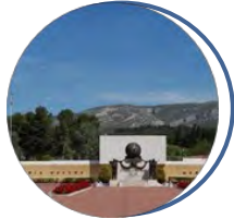
Musée de la Légion étrangère Aubagne