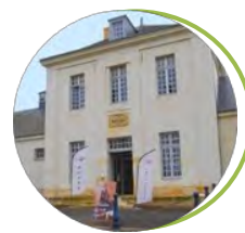
Musée de la Cavalerie Saumur