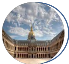
Musée de l'Armée Paris

Seize musées du ministère des Armées, lieux de culture et de patrimoine dans toute la France