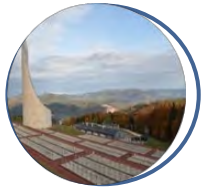
Centre européen du résistant déporté / Struthof Route départementale 130 67130 Natzwiller www.struthof.fr

Six des neuf hauts lieux de la mémoire nationale présentent leur programmation