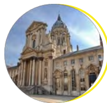
Musée du Service de santé des armées Paris