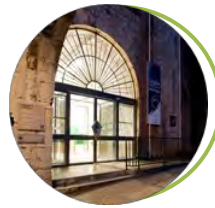
Musée des Troupes de montagne Grenoble