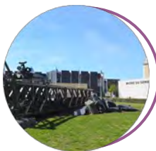
Musée du Génie Angers