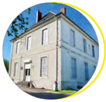
Musée du Train et des Équipages militaires Bourges