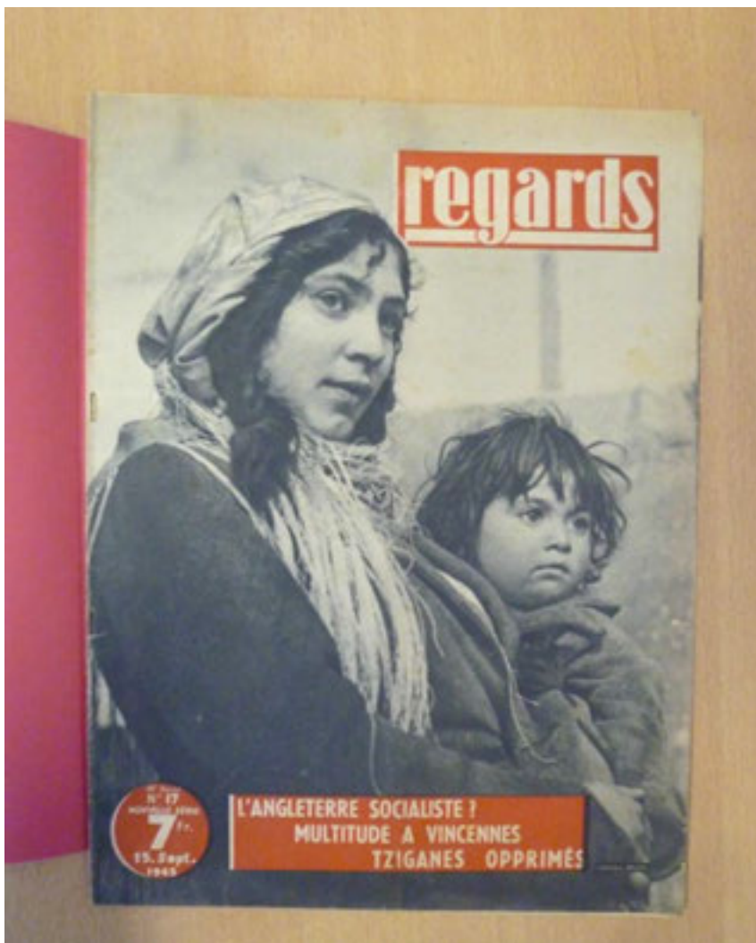
« Tsiganes opprimés ». Reportage paru dans Regards, no 17. 15 septembre 1945.

tout dans les petits camps peu surveillés. À Peigney (Haute-Marne), la moitié des internés recensés en octobre 1942 sont en réalité absents. Toutes les occasions sont bonnes pour fausser compagnie aux gardiens : les transferts à l'hôpital, sur les lieux de travail, lors des permissions, à l'occasion de la visite d'un proche ou lors du mitraillage ou du bombardement du camp par les Alliés, comme c'est le cas à Saliers et à Montreuil-Bellay. Les fugitifs sont repris la plupart du temps dans les jours qui suivent car ils retournent dans des lieux familiers où les attendent les gendarmes ou sont dénoncés par les populations voisines. Les adultes sont condamnés à une peine de prison avant de réintégrer le camp ou d'être transférés dans un camp où le régime de détention est plus sévère comme à Fort-Barraux (Isère) pour les hommes, à Brens (Tarn) pour les femmes.