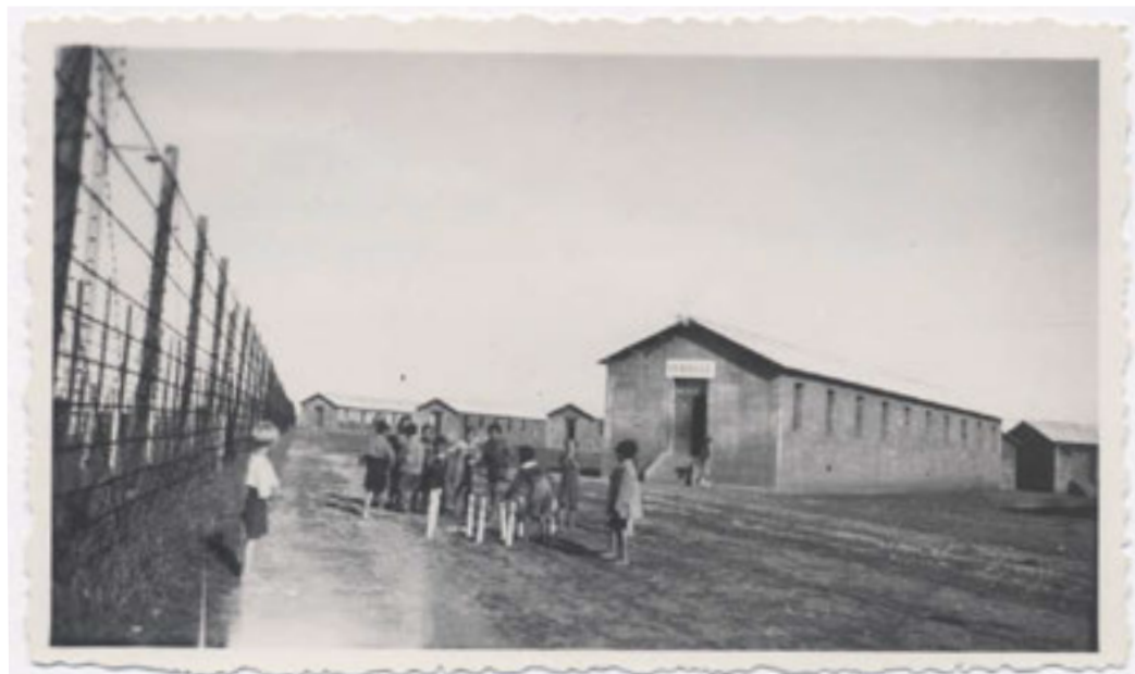
Photographie prise au camp de Montreuil-Bellay le 3 septembre 1943 par Denise Doly (membre de l'ordre des Franciscaines Missionnaires de Marie). Maine-et-Loire. Coll. Soeurs Franciscaines Missionnaires de Marie/Jacques Sigot.

ancienne poudrerie, située près de Saumur, entre 1941 et 1945 et surveillés par des gendarmes français. Des sœurs de la congrégation des Franciscaines Missionnaires de Marie ont volontairement partagé le quotidien des internés et assuré l'instruction religieuse des enfants. En 1943, des libérations sont accordées notamment à des familles belges. Le camp ferme en janvier 1945, les internés restant sont transférés à Jargeau (Loiret) et au camp des Alliers (Charente).