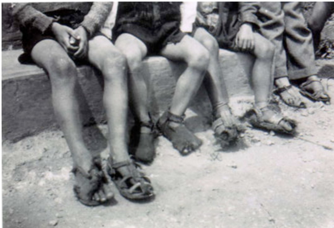
Enfants au camp de Rivesaltes. Pyrénées-Orientales, 1940-1942.

dans des baraques plus ou moins équipées de cloisons, de châlits, de poêles à bois. L'approvisionnement en bois est aléatoire. À Moisdon-la-Rivière (Loire-Atlantique), les internés arrachent les planches de leurs baraques pour faire du feu. Les couvertures sont utilisées pour faire des vêtements.