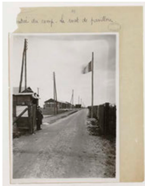
Entrée du camp de Mérignac (Gironde) qui servit de camp d'internement de nomades en novembre et décembre 1940. Photographie prise lors de l'inspection par André Jean-Faure, inspecteur général des camps et centres d'internement du territoire, le 18 décembre 1941.

Le camp de la route de Limoges, à Poitiers, a d'abord été créé pour accueillir les réfugiés espagnols de la Retirada en