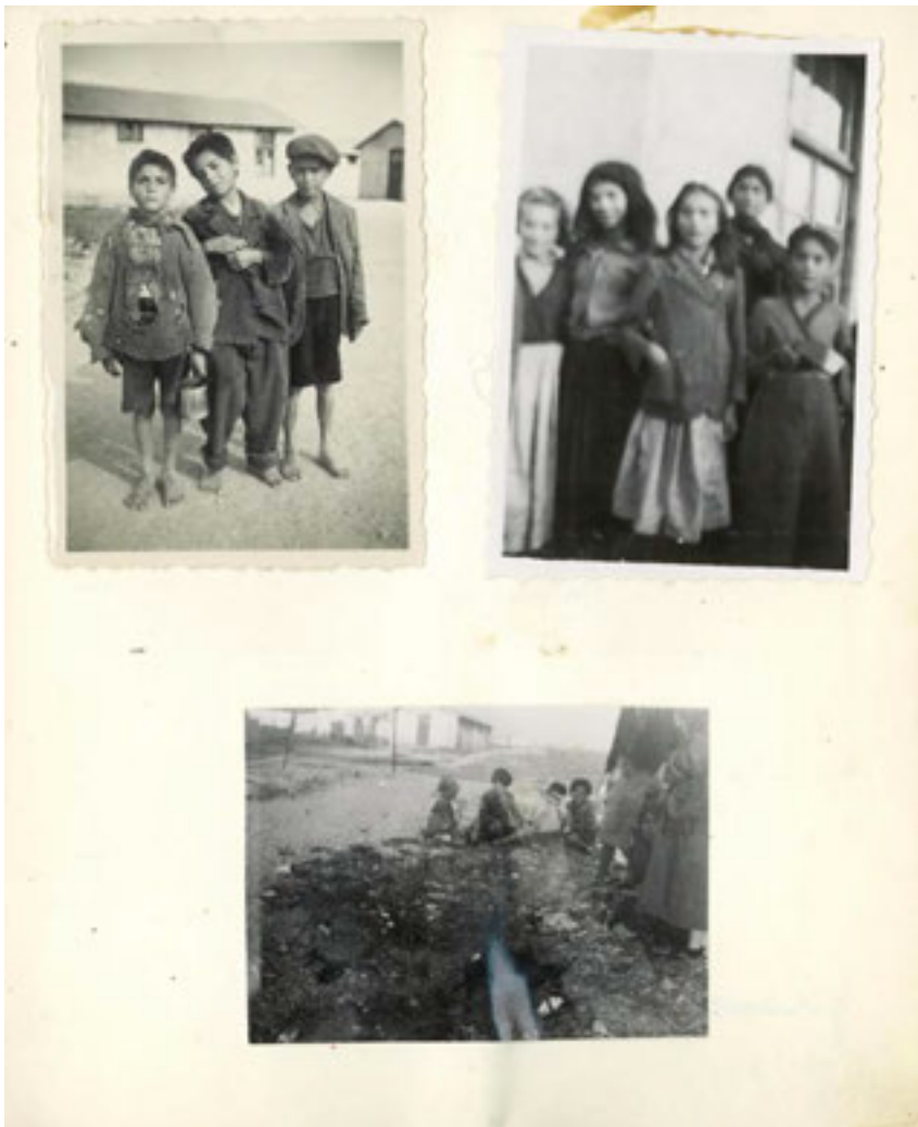
Enfants nomades au camp de Rivesaltes. Pyrénées-Orientales, 1941-1942.