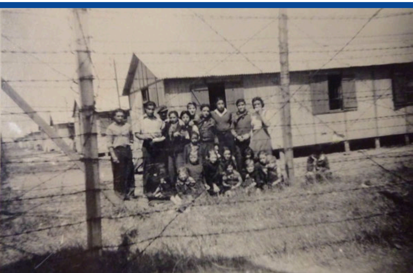
Détenus au camp de Montreuil-Bellay, août 1944, auteur inconnu. Collection Jacques Sigot.