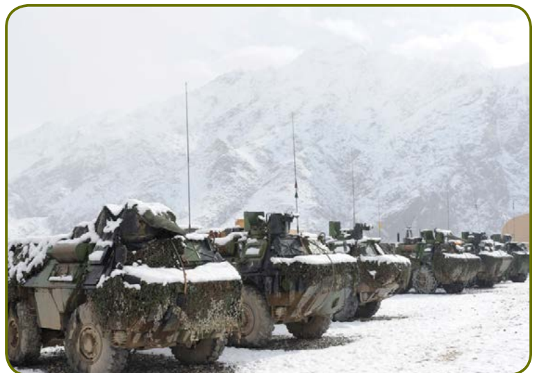
Colonne de véhicules de l'avant blindé du 27 e BCA, en janvier 2009, à Nijrab en Afghanistan.