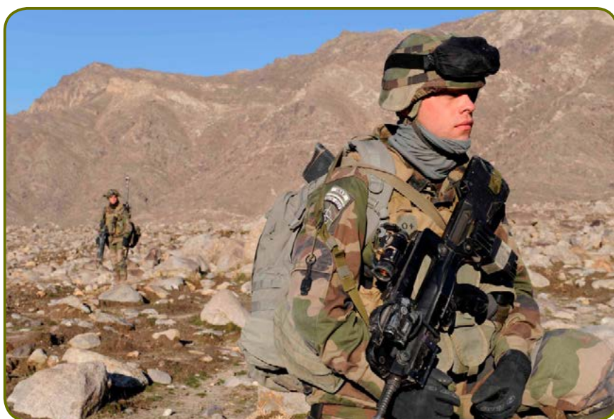
Chasseur alpin en Afghanistan.

Pour le colonel Le Nen : « Le succès de l'opération repose sur une manœuvre qui combine la saisie des hauteurs sud de la vallée, une attaque par l'axe qu'elles surplombent, et une action simultanée sur l'entrée et le fond de la vallée. Il s'agit de déstabiliser les deux lignes de défense des insurgés articulées sur les villages de Darwali et d'Alasay en les menaçant simultanément à partir des hautes et de leurs arrières ».