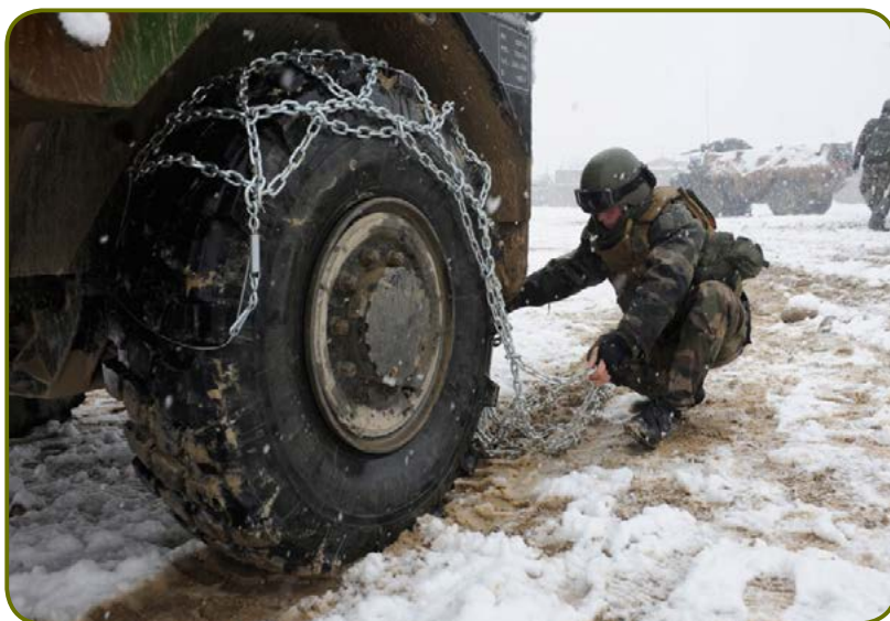
Militaire du 27 e BCA équipant de chaînes la roue d'un VAB en janvier 2009, à Nijrab en Afghanistan.

Enfin, il veut prendre le contrôle physique de toutes les parties peuplées de la province, en implantant des postes de combat pour l'armée nationale afghane (ANA). Son principal but est de repousser son adversaire vers les hautes vallées d'Afghanya, d'Alasay et de Bédraou, puis de le marginaliser en accélérant le développement économique des espaces sous contrôle. L'opération Dinner Out , du 14 au 23 mars 2009, constitue le temps fort du mandat. Son objectif est d'installer deux postes de l'ANA au cœur de la vallée d'Alasay afin d'en assurer le contrôle. Le premier poste doit être implanté à l'est du village de Shehkut pour tenir l'axe sud. Le second est prévu à l'emplacement de la prison d'Alasay.