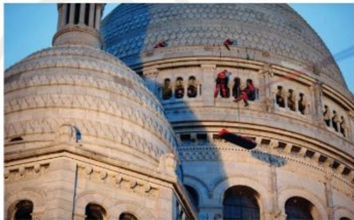
Femme de 40 ans, malade avec perte de connaissance au niveau du dôme du Sacré-Cœur. Évacuation au moyen d'une PRM sur TYRO avec 2 cordes porteuses de 90 mètres. Deux sauteurs accompagnent la mise dans le vide au moyen de 2 cordes d'équipement.

Aujourd'hui, cette équipe d'élite est composée de