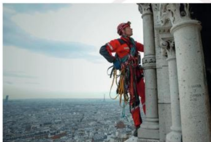
Progression « en tête » d'un sauveteur par l'extérieur du dôme du Sacré-Cœur en vue d'installer un dispositif d'évacuation d'une femme en urgence relative

La spécificité et la technicité de cette unité en font l'une des meilleures de sa catégorie. La RSMU est aujourd'hui reconnue comme faisant partie des unités les plus professionnelles au monde et attirant toujours de nouvelles recrues.