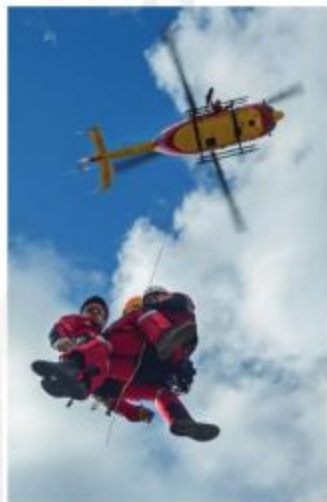
Transport sur opération d'un blessé par Dragon 75 (hélicoptère de la sécurité civile), puis évacuation d'un ouvrier urgence absolue au moyen d'un hélitreuillage.

(GREP). Comprenant à ses débuts une quarantaine de personnes, le GREP, intégré à la 6e compagnie, est basé au centre de secours (CS) d'Issy-les-Moulineaux, à