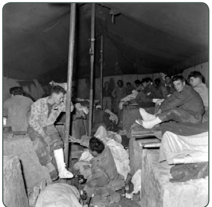
À Diên Biên Phu, les blessés y reçoivent les premiers soins, mars 1954, Daniel Camus / Jean Péraud, SCA - ECPAD.

Pour eux, le mérite revenait à leurs écoles d'origine ayant su conférer à leurs jeunes médecins, en plus de la compétence, cette force morale permettant de surmonter cette terrible épreuve. Leur légitime satisfaction du devoir accompli fut néanmoins assombrie lorsqu'ils apprirent, quatre mois plus tard à leur retour de captivité, l'effroyable mortalité, supérieure à 60 % enregistrée dans les camps d'internement de la troupe (hommes du rang et sous-officiers) alors qu'elle fut plusieurs fois moindre pour les officiers.