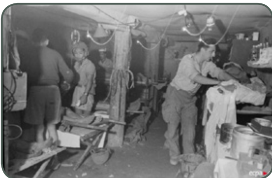
Blessés soignés dans la salle d'opération à l'antenne chirurgicale de Diên Biên Phu, 25 mars 1954

De ce jour, ce ne fut que par parachutage que la bataille pût être alimentée en hommes, vivres et matériel médical, tout espoir d'évacuation par voie aérienne s'évanouit définitivement. Trois antennes chirurgicales parachutistes et cinq médecins des bataillons aéroportés largués dans les jours et les semaines suivantes vinrent renforcer les effectifs et à la fin des combats, vingt-deux médecins étaient présents sur le site.