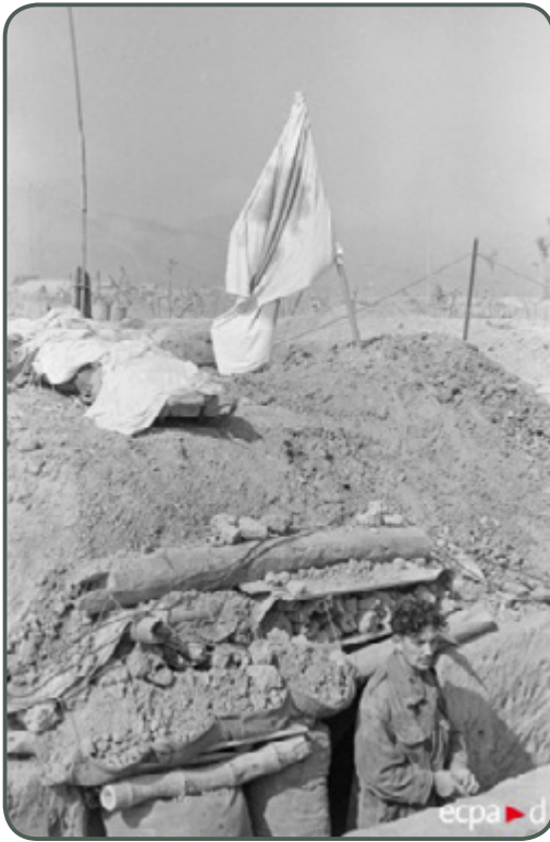
Entrée d'une antenne chirurgicale à Diên Biên Phu, mars 1954