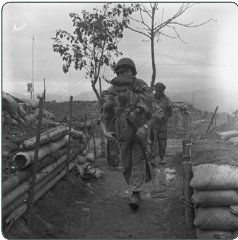
À Diên Biên Phu, un para évacue un camarade vietnamien blessé, mars 1954, Daniel Camus / Jean Péraud, ECPAD.

Ils traitaient également tous les nombreux blessés par éclats, fréquemment porteurs de lésions multiples, mais souvent superficielles, avec des moyens rudimentaires : anesthésies locales ou exceptionnellement générales sous pentothal, stérilisation du matériel par flambage à l'alcool.