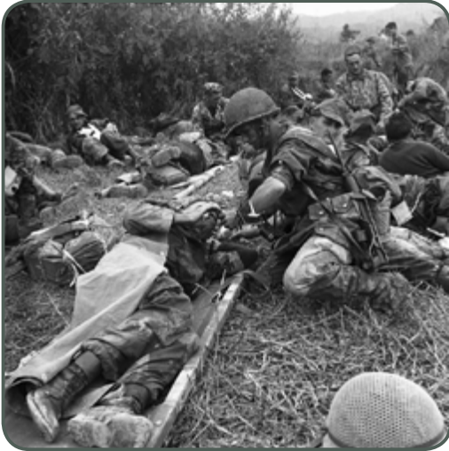
Lors de l'opération "Castor" à Diên Biên Phu, un sergent du 6 e BPC donne à boire à un des blessés, novembre 1953, Daniel Camus, SCA - ECPAD.

C'est au cours de la bataille de Diên Biên Phu que le Service de santé des armées par ses médecins et infirmiers a écrit une très belle page de son histoire. Deux grandes périodes, donc, au cours desquelles l'implication du Service de santé se concrétisa de façon très différente pour s'adapter à la situation opérationnelle du moment. Au cours de la première (20 novembre 1953 au 13 mars 1954) sa politique reposait sur la possibilité quasi permanente, d'utilisation de la piste d'aviation. Étaient assurés sur place les soins de première urgence, de conditionnement, éventuellement de réanimation des blessés ; exceptionnellement quelques interventions plus lourdes imposées par l'extrême urgence. Seuls douze médecins des bataillons étaient engagés et deux antennes chirurgicales mobiles réunies et équipées uniquement pour assurer cette mission fonctionnant grâce à un pont aérien.