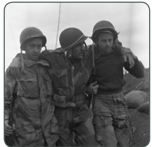
Un para blessé évacué vers l'antenne chirurgicale de Diên Biên Phu, mars 1954

La seconde période (13 mars au 7 mai) imposa d'emblée à tous les acteurs ses nouvelles et terribles réalités. Le 13 mars débuta l'offensive viêt-minh avec deux conséquences pour le Service de santé : d'une part, les combats des 13 et 14 mars sur Béatrice et Gabrielle générèrent en deux jours et trois nuits plusieurs centaines de blessés ; d'autre part, l'utilisation de la piste d'aviation devint de plus en plus aléatoire et très risquée du fait d'une DCA ennemie très performante. Au prix de grands risques, les pilotes évacuent sur Hanoï une centaine de blessés, dont deux médecins. Mais l'étau se resserra très vite. Le dernier avion se posa le 26 mars, mais, gravement endommagé, il ne put repartir ; à son bord se trouvait Geneviève de Galard. Les hélicoptères parvinrent à évacuer une centaine de blessés, mais la destruction de l'un d'eux au décollage mit fin à toute possibilité d'évacuation sanitaire.