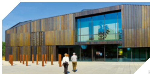
MUSÉE DE LA GUERRE DE 1870 ET DE L'ANNEXION (57)