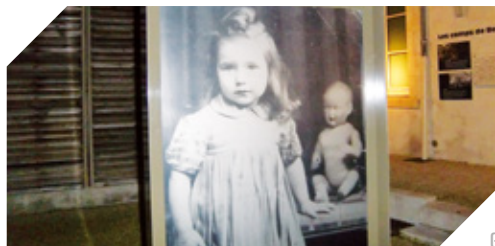
CERCIL - MUSÉE MÉMORIAL DES ENFANTS DU VEL D'HIV (45)