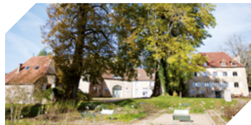
MUSÉE DE LA RÉSISTANCE EN MORVAN (58)