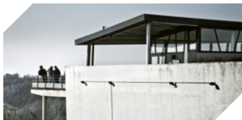
CAVERNE DU DRAGON - MUSÉE DU CHEMIN DES DAMES (02)