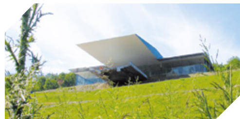
MÉMORIAL D'ALSACE-MOSELLE (67)