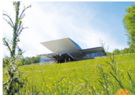
Mémorial de l'Alsace-Moselle (Schirmeck, Bas-Rhin)