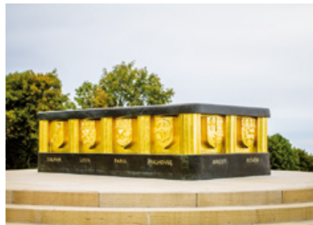
Monument national de l'Hartmannswillerkopf (Wattwiller, Haut-Rhin)