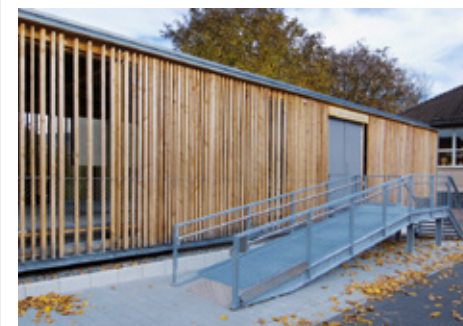
Neckarelz - camp annexe de Natzweiler-Struthof (Mosbach, Allemagne)