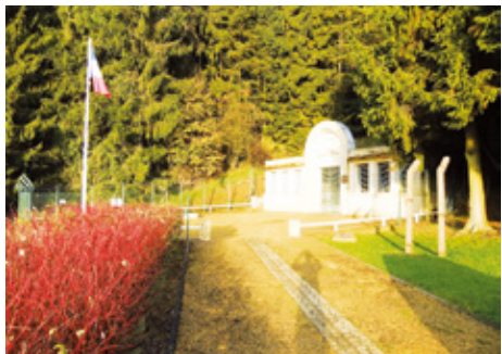
Nécropole de Thil - camp annexe de Natzweiler-Struthof (Thil, Meurthe-et-Moselle)