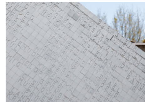
Hailfingen-Tailfingen - camp annexe de Natzweiler-Struthof (Gäufelden, Allemagne)