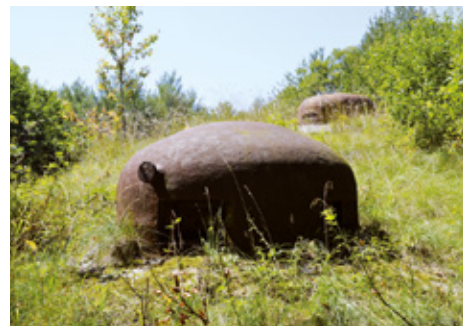
Ouvrage du Simserhof (Siersthal, Moselle)