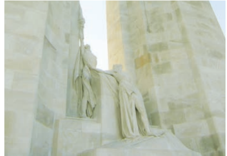
Mémorial canadien (Vimy, Pas-de-Calais)