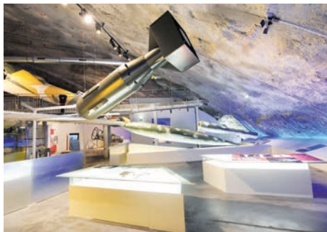
Centre d'histoire La Coupole (Saint-Omer, Pas-de-Calais)