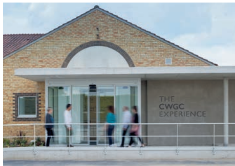
The CWGC Experience (Beaurains, Pas-de-Calais)