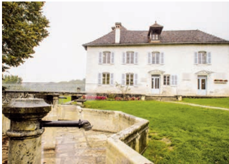
Maison d'Izieu - Mémorial des enfants juifs exterminés (Izieu, Ain)