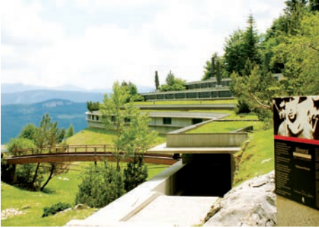
Mémorial de la Résistance en Vercors (Vassieux-en-Vercors, Drôme)