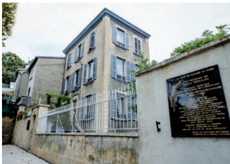
Mémorial Jean Moulin (Caluire, Rhône)