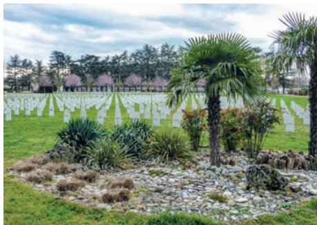
Nécropole nationale de La Doua (Villeurbanne, Rhône)