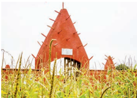
Nécropole nationale du Tata sénégalais (Chasselay, Rhône)