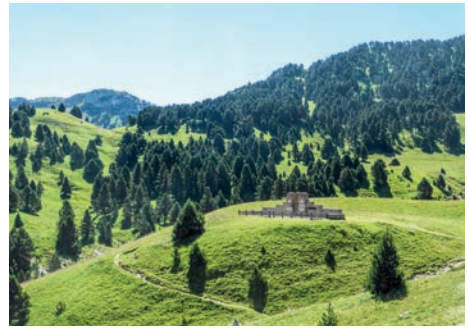
Nécropole nationale du Pas de l'Aiguille (Chichilianne, Isère)