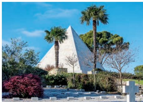
Nécropole nationale de Saint-Mandrier (Saint-Mandrier-sur-Mer, Var)