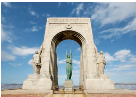
Monument aux morts de l'armée d'Orient (Marseille, Bouches-du-Rhône)