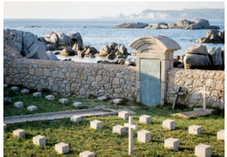
Nécropole nationale des îles Lavezzi (Bonifacio, Corse-du-Sud)