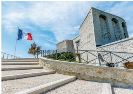
Mémorial du débarquement et de la libération en Provence (Toulon, Var)