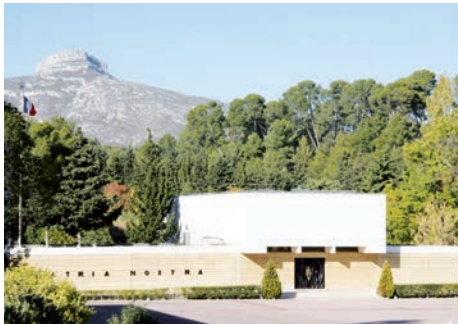
Musée de la Légion étrangère (Aubagne, Bouches-du-Rhône)