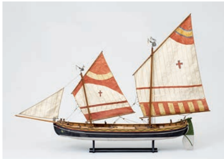
Annexe du Musée de la Marine (Toulon, Var)