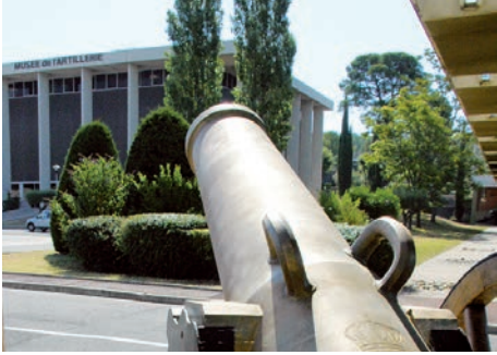
Musée de l'artillerie (Draguignan, Var)