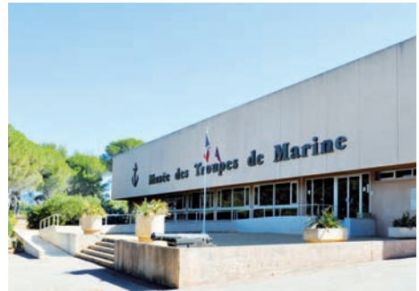
Musée des troupes de marine (Fréjus, Var)