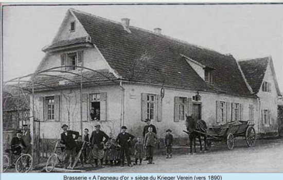
Brasserie « A l'agneau d'or » siège du Krieger Verein (vers 1890)