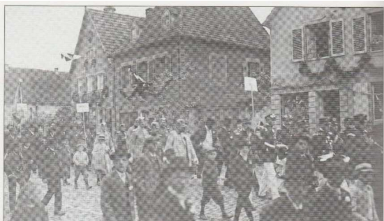
Défilé des délégations du Kriegsverein le 6 octobre 1889 lors de l'inauguration du monument au cimetière.