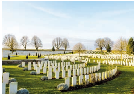
Cimetière britannique du Cabaret-Rouge (Souchez, Pas-de-Calais)