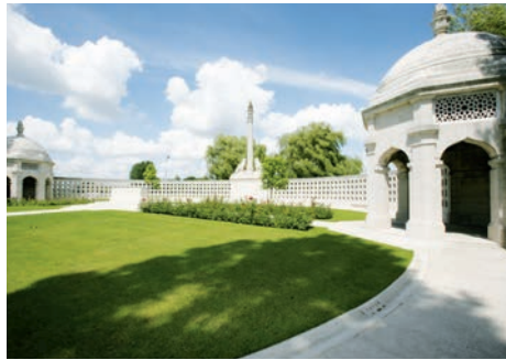
Mémorial indien de Neuve-Chapelle (Richebourg, Pas-de-Calais)