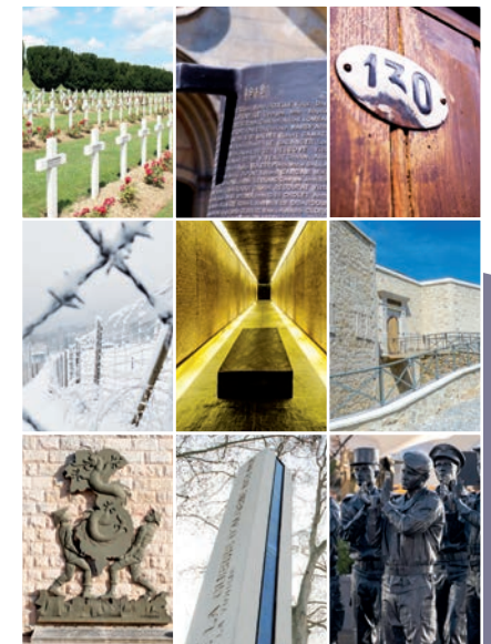
Février 2022 - SGA/DPMA - Maquette SGA/COM

Nécropole nationale de Fleury-devant-Douaumont et la tranchée des baïonnettes (Douaumont, Meuse) • Mémorial du Mont-Valérien (Suresnes, Hauts-de-Seine) • Mémorial national de la prison de Montluc (Lyon, Rhône) • Camp de concentration du Struthof (Natzwiller, Bas-Rhin) • Mémorial des martyrs de la Déportation (Île de la Cité, Paris) • Mémorial du débarquement et de la libération en Provence (Toulon, Var) • Mémorial des guerres en Indochine (Fréjus, Var) • Mémorial national de la guerre d'Algérie et des combats du Maroc et de la Tunisie (Quai Jacques-Chirac, Paris) • Monument aux Morts pour la France en opérations extérieures (Parc André Citroën, Paris).