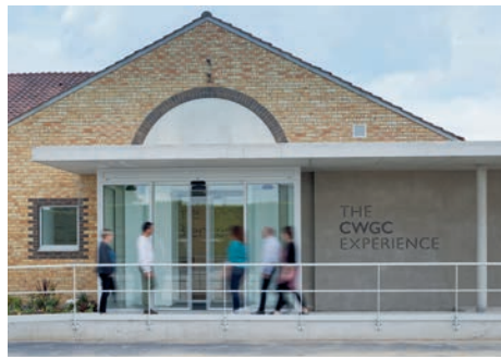
The CWGC Experience (Beaurains, Pas-de-Calais)