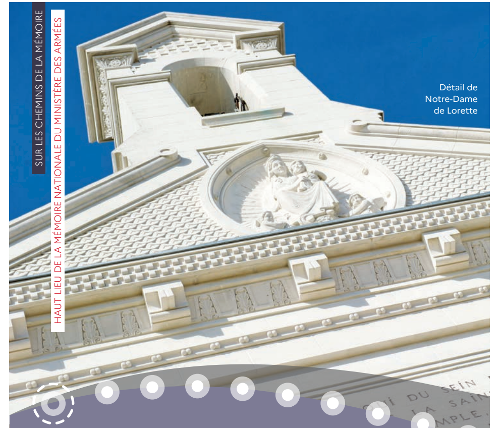
Détail de Notre-Dame de Lorette

SUR LES CHEMINS DE LA MÉMOIRE HAUT LIEU DE LA MÉMOIRE NATIONALE DU MINISTÈRE DES ARMÉES