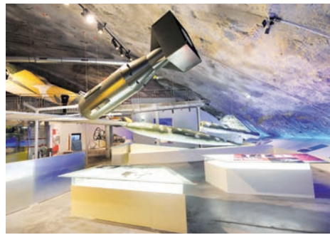
Centre d'histoire La Coupole (Saint-Omer, Pas-de-Calais)