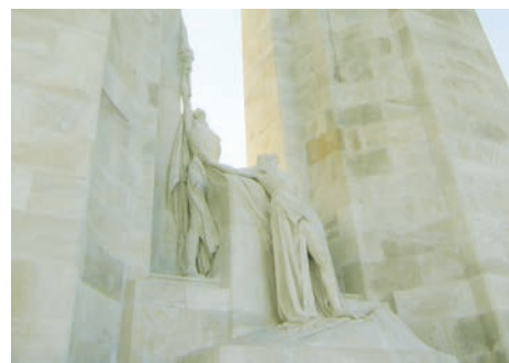
Mémorial canadien (Vimy, Pas-de-Calais)