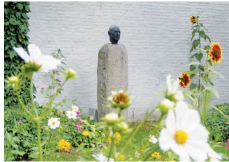
Maison natale de Charles de Gaulle (Lille, Nord)