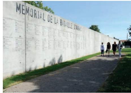
Carrière Wellington (Arras, Pas-de-Calais)