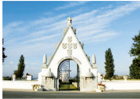
Cimetière portugais (Richebourg, Pas-de-Calais)