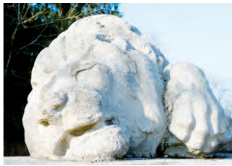
Monument du Lion (Douaumont, Meuse)