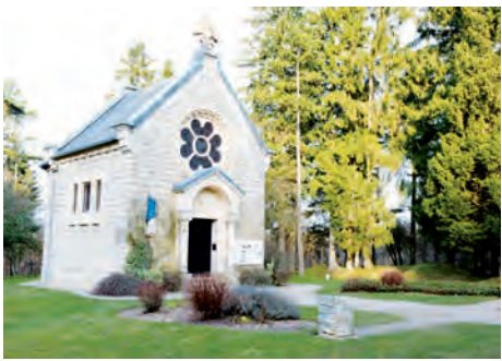
Villages détruits de la Zone Rouge (Douaumont, Meuse)