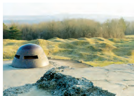
Forts de Vaux et de Douaumont (Douaumont, Meuse)