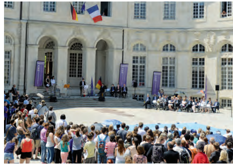
Centre mondial de la paix (Verdun, Meuse)