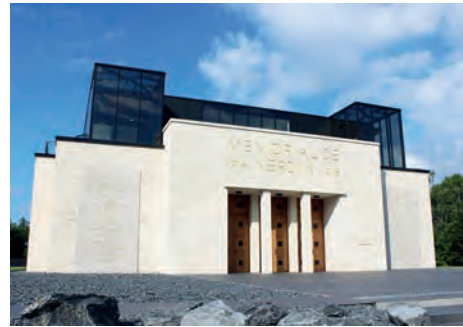
Mémorial de Verdun (Douaumont, Meuse)