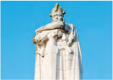
Monument de la Victoire (Verdun, Meuse)