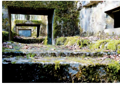
Poste de commandement du colonel Driant (Bois des Caures, Meuse)