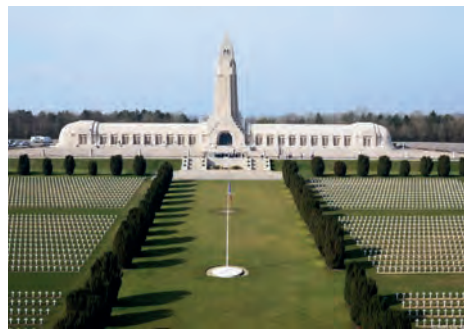
Ossuaire de Douaumont (Douaumont, Meuse)