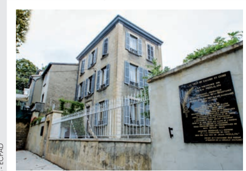
Mémorial Jean Moulin (Caluire, Rhône)