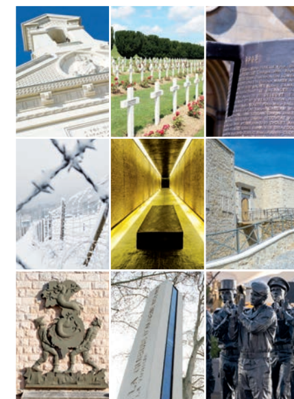
Février 2022 - SGA/DPMA - Maquette SGA/COM

Nécropole nationale de Notre-Dame-de-Lorette (Abblain-St-Nazaire, Pas de Calais) • Nécropole nationale de Fleury-devant-Douaumont et la tranchée des baïonnettes (Douaumont, Meuse) • Mémorial du Mont-Valérien (Suresnes, Hauts-de-Seine) • Camp de concentration du Struthof (Natzwiller, Bas-Rhin) • Mémorial des martyrs de la Déportation (Île de la Cité, Paris) • Mémorial du débarquement et de la libération en Provence (Toulon, Var) • Mémorial des guerres en Indochine (Fréjus, Var) • Mémorial national de la guerre d'Algérie et des combats du Maroc et de la Tunisie (Quai Jacques-Chirac, Paris) • Monument aux Morts pour la France en opérations extérieures (Parc André Citroën, Paris).