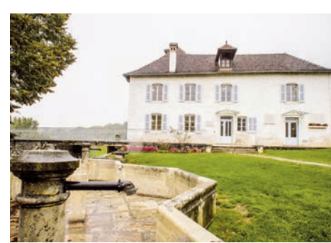
Maison d'Izieu - Mémorial des enfants juifs exterminés (Izieu, Ain)