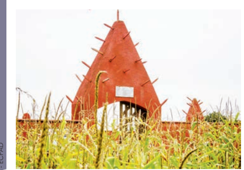
Nécropole nationale du Tata sénégalais (Chasselay, Rhône)