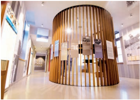
Centre d'histoire de la Résistance et de la Déportation (Lyon, Rhône)