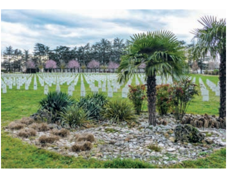
Nécropole nationale de La Doua (Villeurbanne, Rhône)