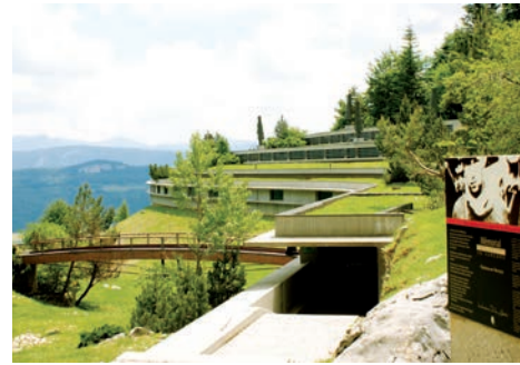
Mémorial de la Résistance en Vercors (Vassieux-en-Vercors, Drôme)