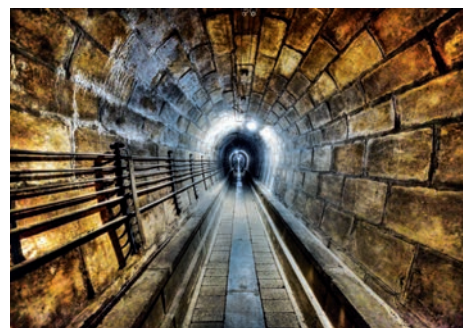
Fort de Mutzig (Dinsheim-sur-Bruche, Bas-Rhin)