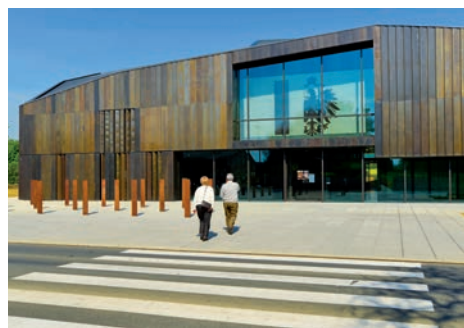
Musée de la Guerre de 1870 et de l'Annexion (Gravelotte, Moselle)