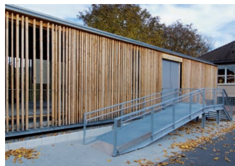
Neckarelz - camp annexe de Natzweiler-Struthof (Mosbach, Allemagne)