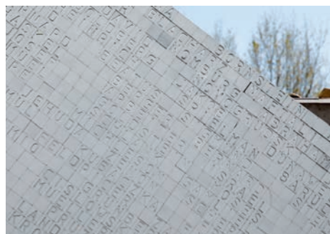
Hailfingen-Tailfingen - camp annexe de Natzweiler-Struthof (Gäufelden, Allemagne)