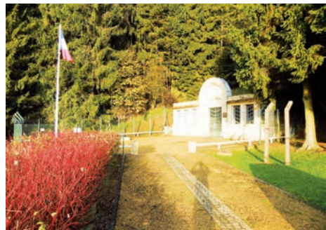
Nécropole de Thil – camp annexe de Natzweiler-Struthof (Thil, Meurthe-et-Moselle)