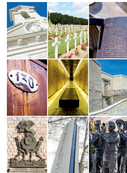
Février 2022 - SGA/DPMA - Maquette SGA/COM

Nécropole nationale de Notre-Dame-de-Lorette (Ablain-St-Nazaire, Pas de Calais) • Nécropole nationale de Fleury-devant-Douaumont et la tranchée des baïonnettes (Douaumont, Meuse) • Mémorial du Mont-Valérien (Suresnes, Hauts-de-Seine) • Mémorial national de la prison de Montluc (Lyon, Rhône) • Mémorial des martyrs de la Déportation (Île de la Cité, Paris) • Mémorial du débarquement et de la libération en Provence (Toulon, Var) • Mémorial des guerres en Indochine (Fréjus, Var) • Mémorial national de la guerre d'Algérie et des combats du Maroc et de la Tunisie pour la France en opérations extérieures (Parc André Citroën, Paris).