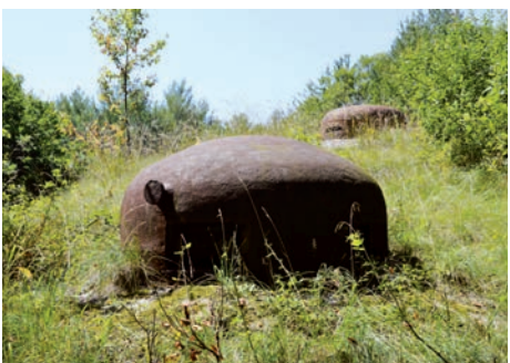
Ouvrage du Simserhof (Siersthal, Moselle)