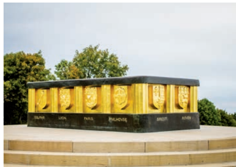
Monument national de l'Hartmannswillerkopf (Wattwiller, Haut-Rhin)