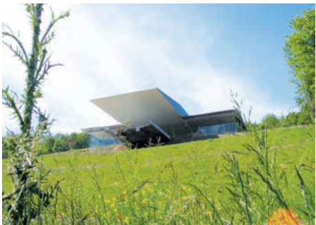
Mémorial de l'Alsace-Moselle (Schirmeck, Bas-Rhin)