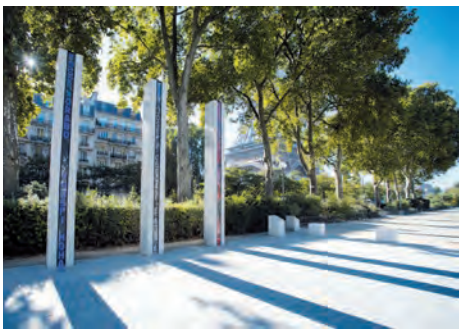
Mémorial national de la guerre d'Algérie et des combats du Maroc et de la Tunisie Quai Jacques-Chirac (Paris VII e )