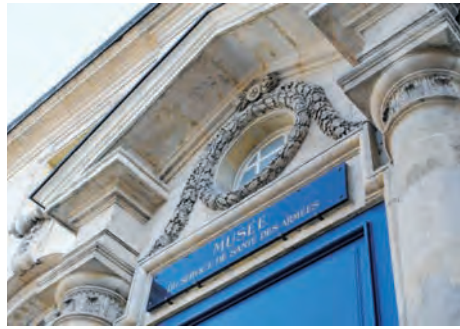
Musée du service de santé des armées Val de Grâce (Paris V e )