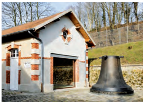
Mémorial du Mont-Valérien Suresnes (Hauts-de-Seine)