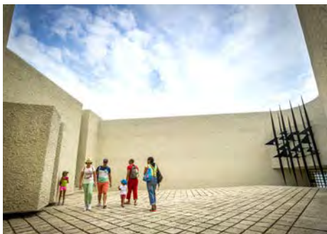
Mémorial des martyrs de la Déportation Île de la Cité (Paris IV e )