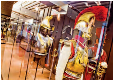
Musée de l'Armée Hôtel national des Invalides (Paris VII e )