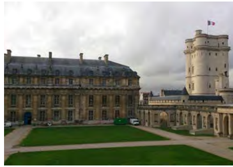
Service historique de la Défense (Vincennes, Val-de-Marne)