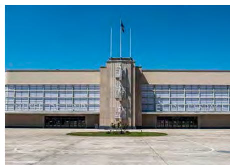
Musée de l'Air et de l'Espace (Le Bourget, Seine-Saint-Denis)