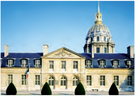
Musée de l'Ordre de la Libération Hôtel national des Invalides (Paris VII e )