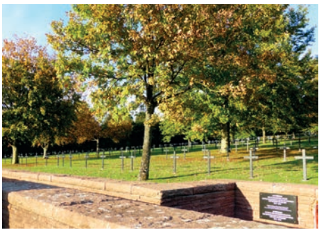
Cimetière militaire allemand de Consenvoye (Meuse)