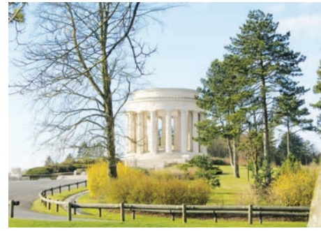
Mémorial américain de la Butte de Montsec (Meuse)