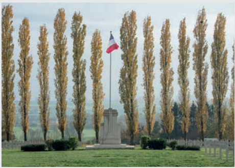
Verdun Bévoux (Meuse)