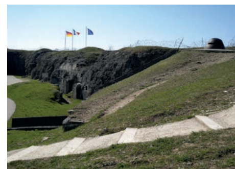
Forts de Vaux et de Douaumont (Meuse)