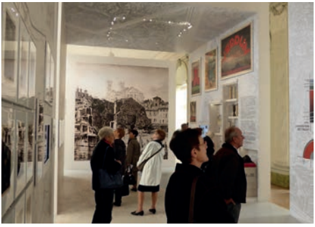
Centre mondial pour la paix de Verdun (Meuse)