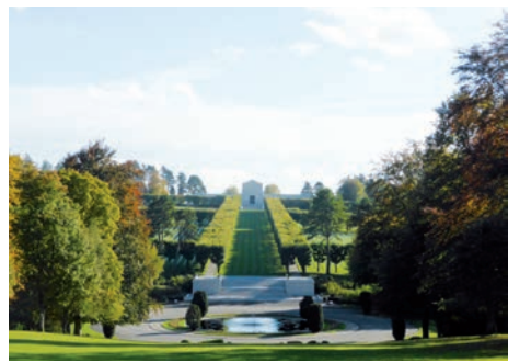
Mémorial et cimetière militaires américains de Romagne-sous-Montfaucon (Meuse)