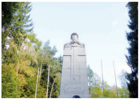
Monument ossuaire de la Haute Chevauchée (Meuse)