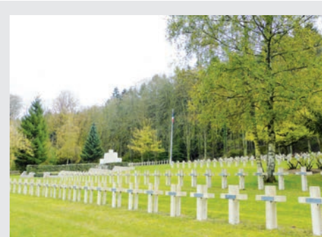
Les Éparges - Le Trottoir (Meuse)