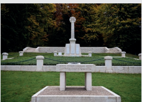
Apremont-la-Forêt - La Marbotte (Meuse)