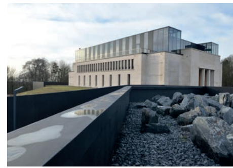
Mémorial de Verdun (Meuse)