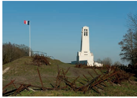
Butte de Vauquois (Meuse)