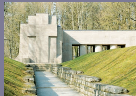
Tranchée des baïonnettes (Meuse)