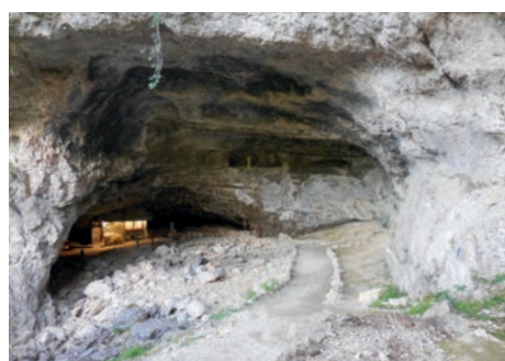
Grotte de la Luire Saint-Agnan en Vercors (Drôme)