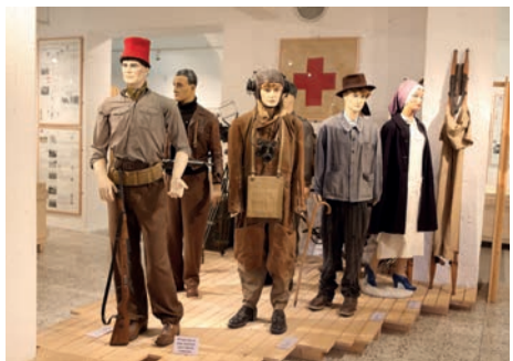
Musée départemental de la Résistance de Vassieux-en-Vercors (Drôme)