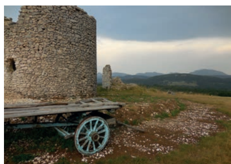
Ruines de la Mûre Vassieux-en-Vercors (Drôme)