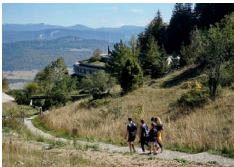
Mémorial de la Résistance Col de la Chau (Drôme)