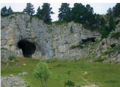
Grottes du Pas de l'Aiguille Chichilianne (Isère)