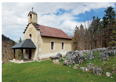
Ruines de Valchevrière (Isère)