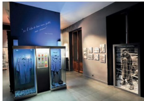
Musée de la Résistance et de la Déportation de Romans-sur-Isère (Drôme)