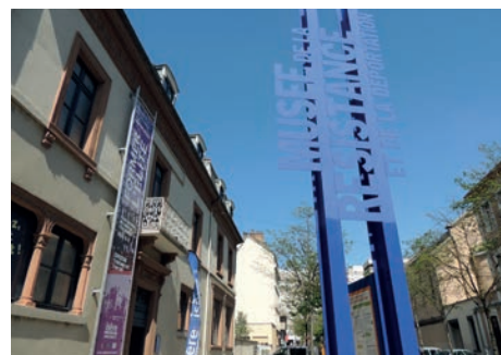
Musée de la Résistance et de la Déportation de Grenoble (Isère)