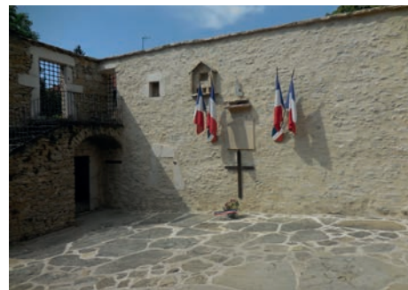
Cour des fusillés La Chapelle en Vercors (Drôme)