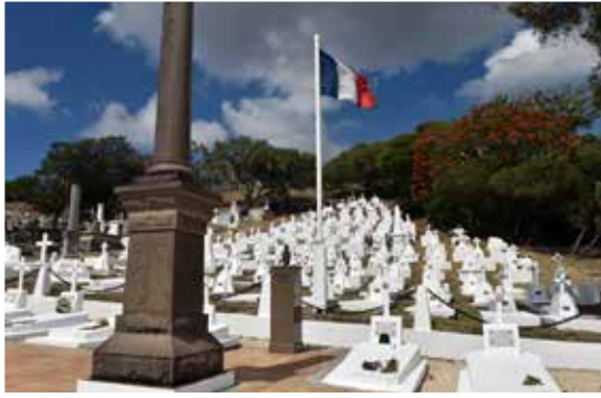
Carré militaire de Nouméa (Nouvelle-Calédonie)