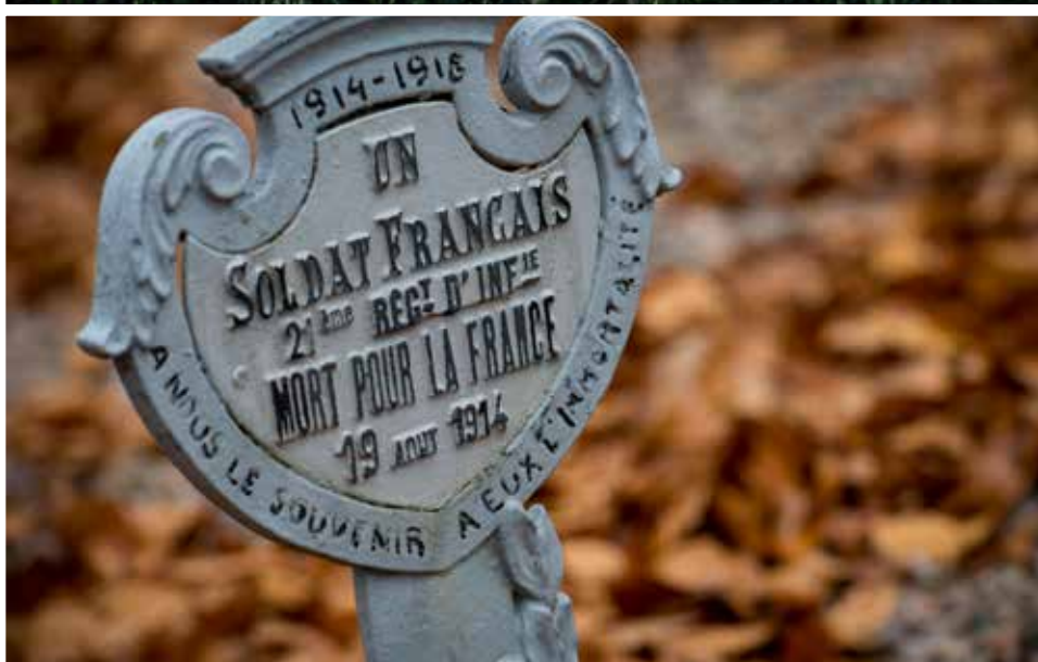
Nécropole nationale de Wisches (67)