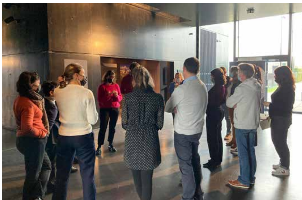
Séminaire RMMCC au Centre d'histoire du mémorial 14-18 de Notre-Dame de Lorette (62).

La demande d'autorisation d'installer un panneau de signalisation touristique sur une route départementale est à adresser au service de la voirie du conseil départemental compétent. La DMCA peut être tenue informée par le requérant afin d'obtenir son agrément.