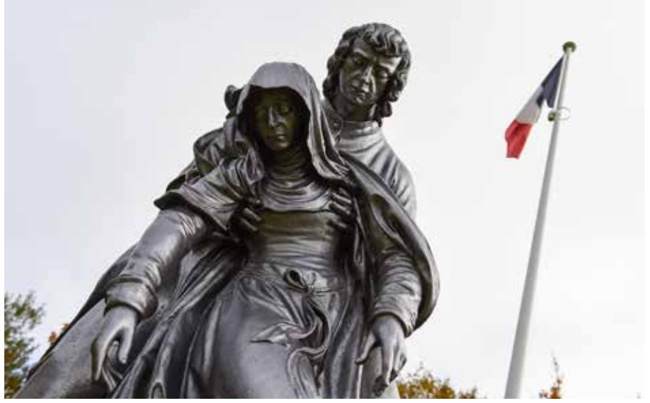
Nécropole nationale Vaux-Racine à Saint-Mihiel (55)