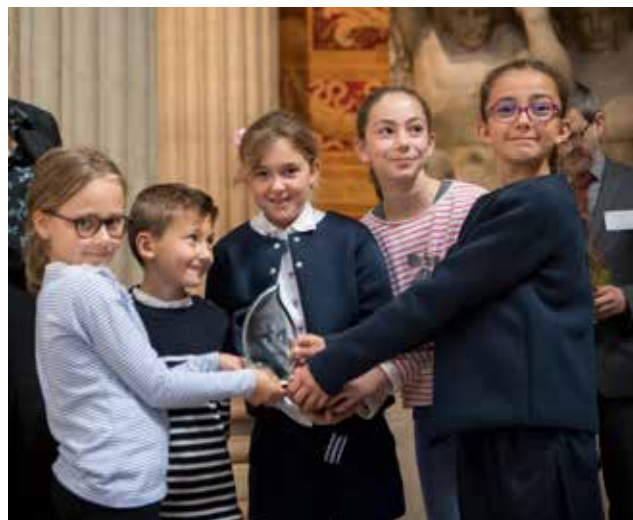
Cérémonie Héritiers de mémoire