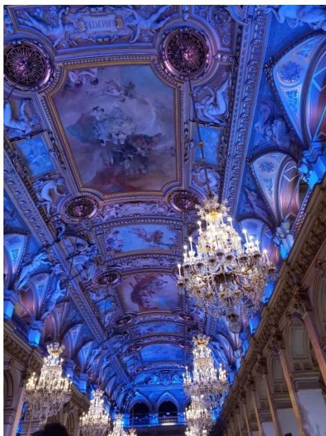
Plafond de la salle de remise des prix, à l'Hôtel de Ville parisien