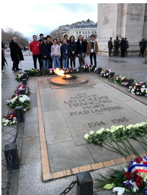
Les lauréats Du 29 e prix du civisme et de la Mémoire de la FNAM devant la tombe du soldat inconnu

Enfin, la touche finale de cette cérémonie, fut le ravivage de la flamme de la tombe du soldat inconnu sous l'Arc de Triomphe. Pour rappel, ce soldat français de la première guerre mondiale, tombé au champ d'honneur, dont le nom n'a pas pu être retrouvé, fut inhumé en 1919 sous l'Arc de Triomphe (dont les plus historiens d'entre vous se souviendront du début de sa construction en 1806 par Napoléon Ier). La flamme fut ajoutée en 1923, et depuis, elle est ravivée tous les jours sans aucune exception, elle ne s'est jamais éteinte et ne s'éteindra pas de sitôt, symbole de la patrie française, du devoir de mémoire et du respect porté aux anciens combattants. Le premier qui raviva cette flamme, en 1923, fut André Maginot lui-même, d'où notre présence en ces lieux symboliques. La cérémonie, présidée par le Général (2 S) René PETER, et animée par M. Thierry LEFEBVRE, permit à tous les lauréats du prix de la Mémoire et du Civisme, de déposer une rose blanche sur cette tombe, et deux d'entre eux purent raviver la flamme du soldat inconnu. Ce fut un moment hors du temps, un moment où les pensées de tous partirent vers ceux qui firent le sacrifice suprême pour leur Nation, ceux d'hier et ceux d'aujourd'hui.