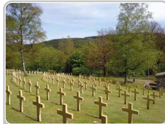
Cimetière militaire franco-allemand de Neufchateau (Belgique).

Dans les autres pays, les lieux de sépultures militaires français sont entretenus par les gouvernements, les collectivités et les associations locales. Le ministère des Armées y assure une veille mémorielle.