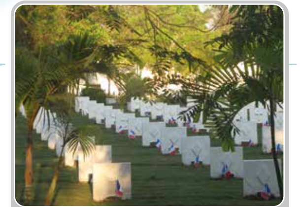
Cimetière militaire français de Vientiane (Laos).