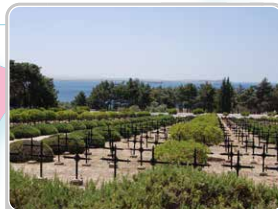
Cimetière militaire français de Seddulbahir (Turquie).