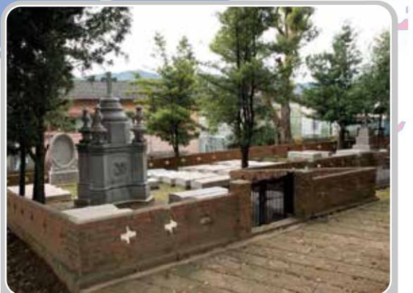
Carré militaire français du cimetière international de Nagasaki (Japon).