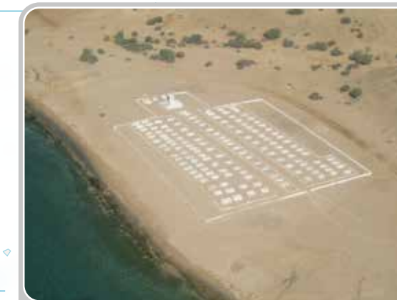
Cimetière militaire marin français d'Obock (Djibouti).