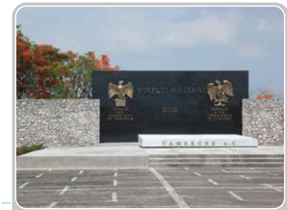
Mémorial de Camerone (Mexique).