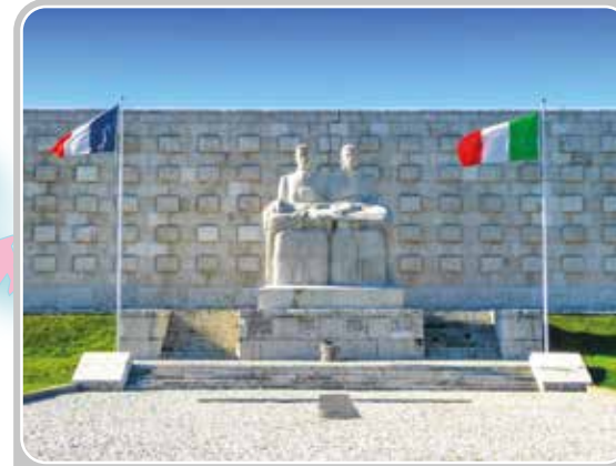
Monument-ossuaire français de Pederobba (Italie).