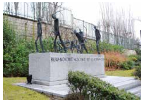
Cimetière du Père Lachaise 97 e division (Paris XX e )