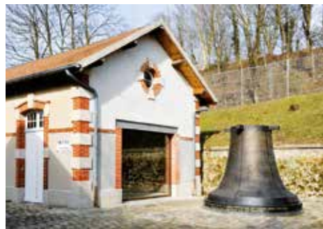
Mémorial du Mont-Valérien (Suresnes, Hauts-de-Seine)