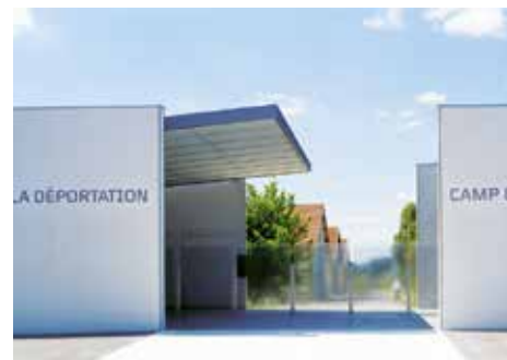
Mémorial de l'internement et de la déportation - Camp de Royallieu (Compiègne, Oise)