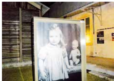
CERCIL - Musée mémorial des enfants du Vel d'Hiv (Orléans, Loiret)