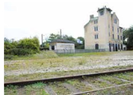
Ancienne gare de déportation (Bobigny, Seine-Saint-Denis)