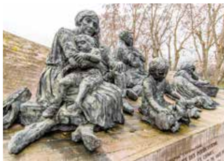
Monument de la rafle du Vél d'Hiv Place des Martyrs Juifs du Vélodrome d'Hiver (Paris XV e )