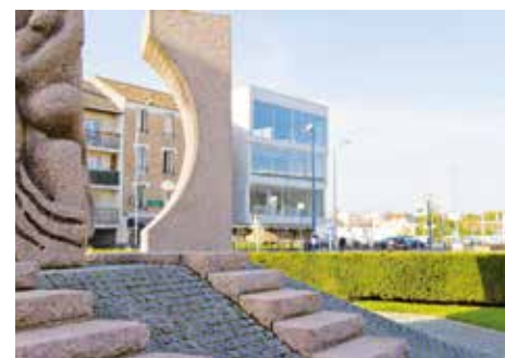
Mémorial de la Shoah à Drancy (Drancy, Seine-Saint-Denis)