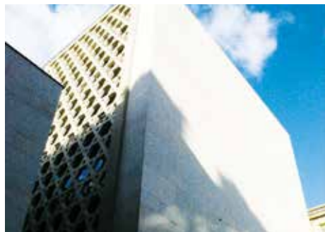
Mémorial de la Shoah (Rue Geoffroy l'Asnier, Paris IV e )