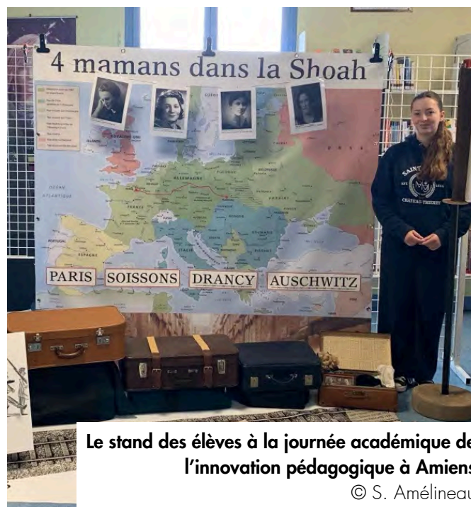
Le stand des élèves à la journée académique de l'innovation pédagogique à Amiens

Un film documentaire de 90 minutes a également été produit par ces élèves sur le destin de ces quatre femmes et de leurs proches.