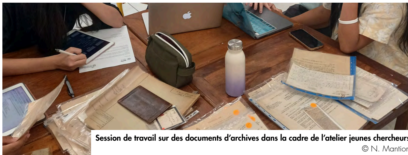
Session de travail sur des documents d'archives dans la cadre de l'atelier jeunes chercheurs