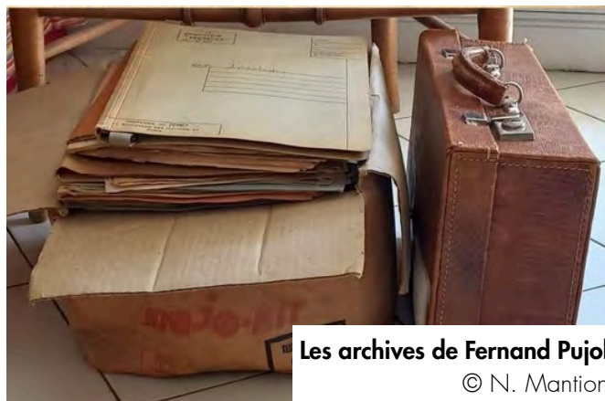
Les archives de Fernand Pujol

L'enseignante a mis en place un « atelier jeunes chercheurs » qui réunit, tous les mercredis, des élèves volontaires en classe de seconde générale et technologique. Le processus de recherche s'organise pendant les sessions de l'atelier. Le travail d'analyse des documents d'archives suit une méthode scientifique afin d'initier les élèves aux exigences de l'histoire.