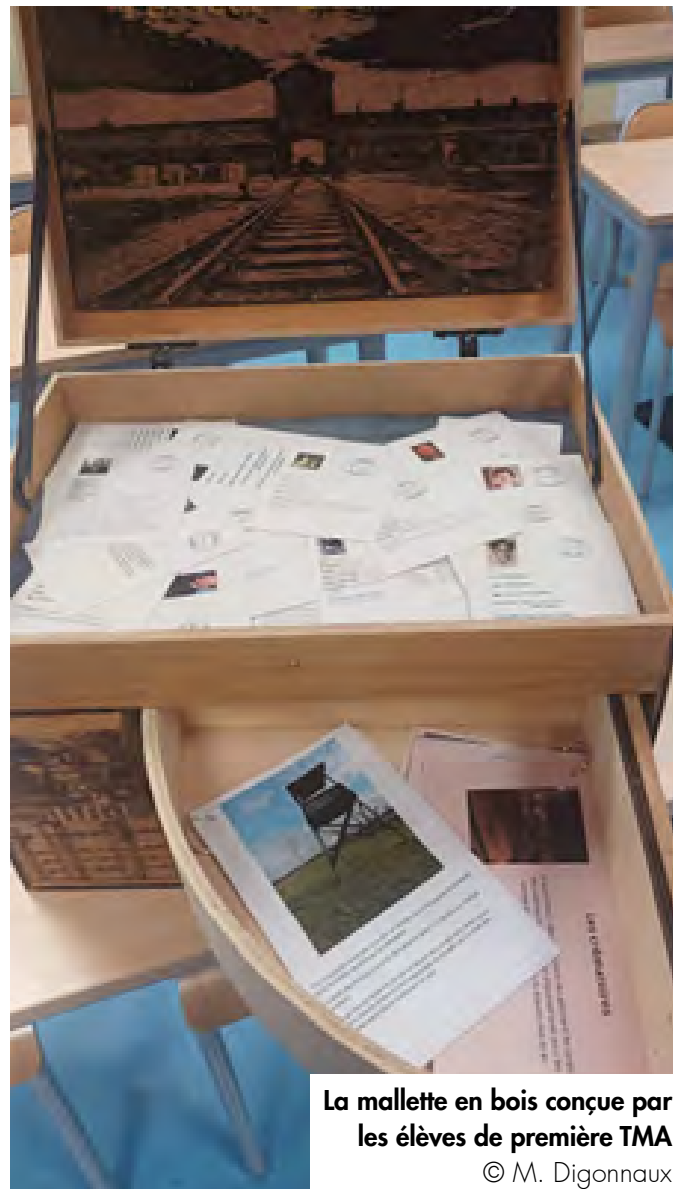
La mallette en bois conçue par les élèves de première TMA

Afin de poursuivre le projet et enrichir la mallette, l'enseignante a choisi, pour l'année 2024-2025, d'inscrire ses élèves de première