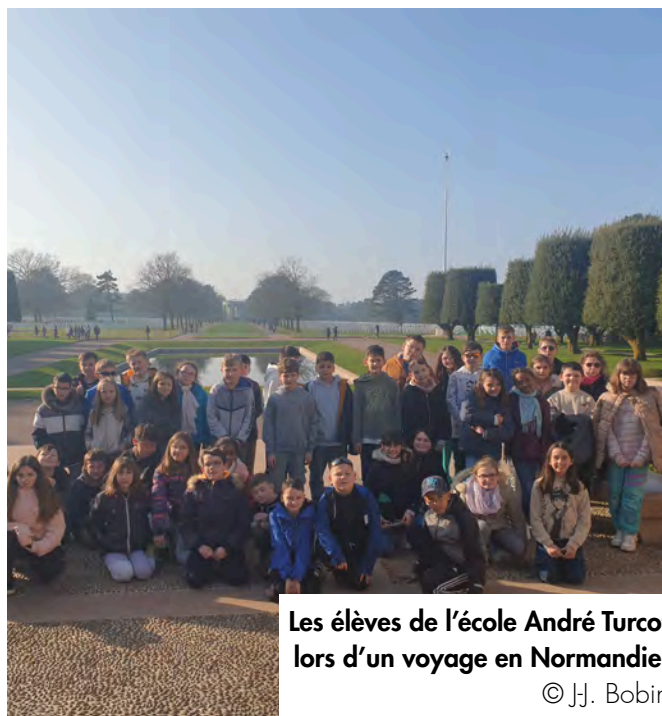
Les élèves de l'école André Turcot lors d'un voyage en Normandie.

Ce projet de qualité, porté par une école primaire a reçu le label « Mission Libération », dans le cadre du cycle commémoratif des 80 ans de la Libération porté par le groupement d'intérêt public (GIP) « Mission Libération ».