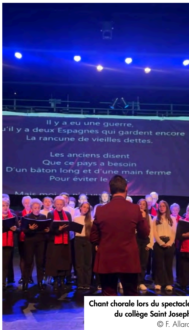
Chant chorale lors du spectacle du collège Saint Joseph

Comme le souligne l'enseignant, « ce projet, plus qu'un spectacle, fut une traversée sensible et lucide des ombres du passé, pour faire de la mémoire un chant vivant » .