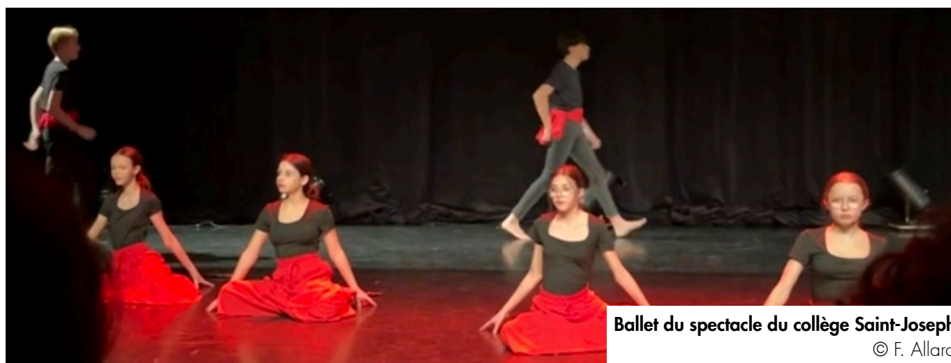
Ballet du spectacle du collège Saint-Joseph