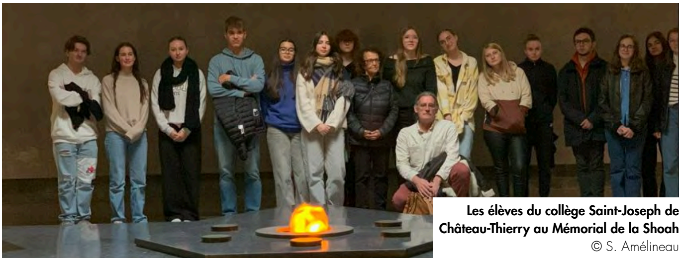
Les élèves du collège Saint-Joseph de Château-Thierry au Mémorial de la Shoah