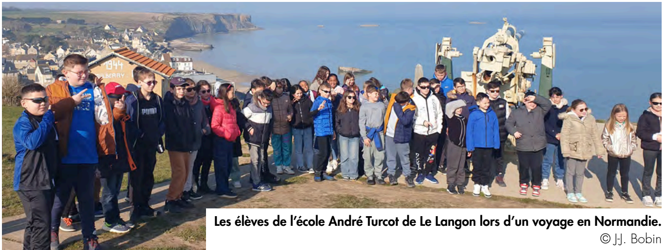
Les élèves de l'école André Turcot de Le Langon lors d'un voyage en Normandie.