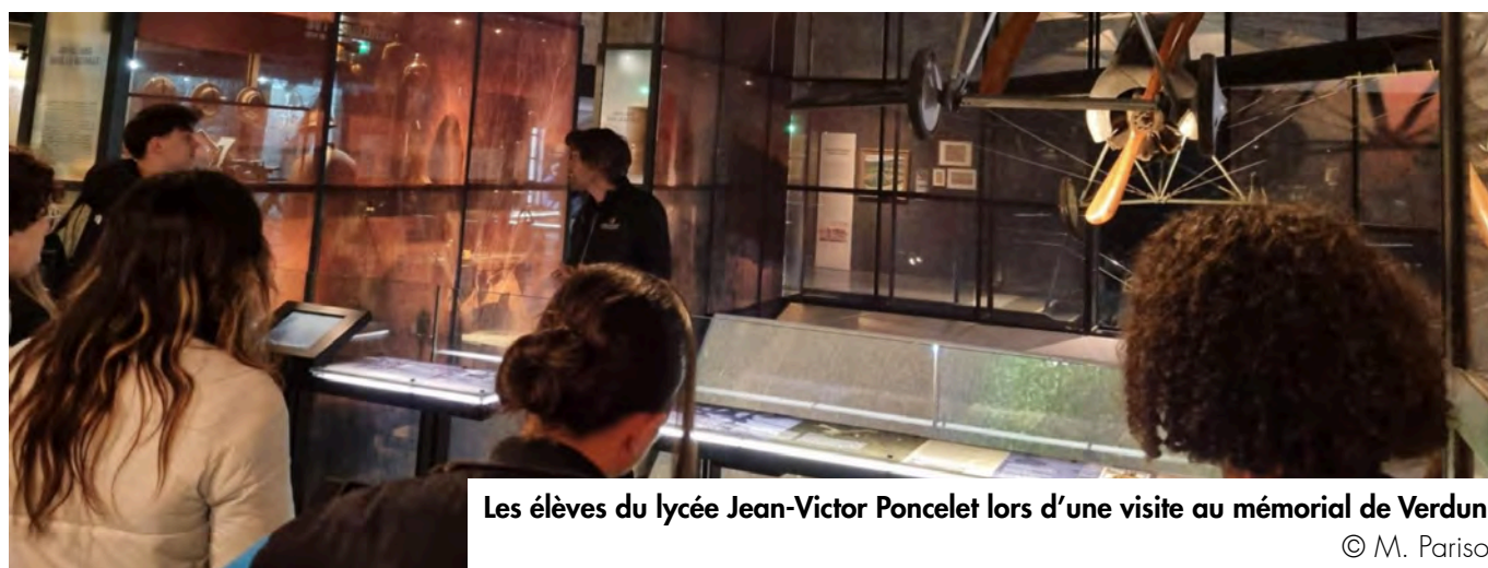
Les élèves du lycée Jean-Victor Poncelet lors d'une visite au mémorial de Verdun.