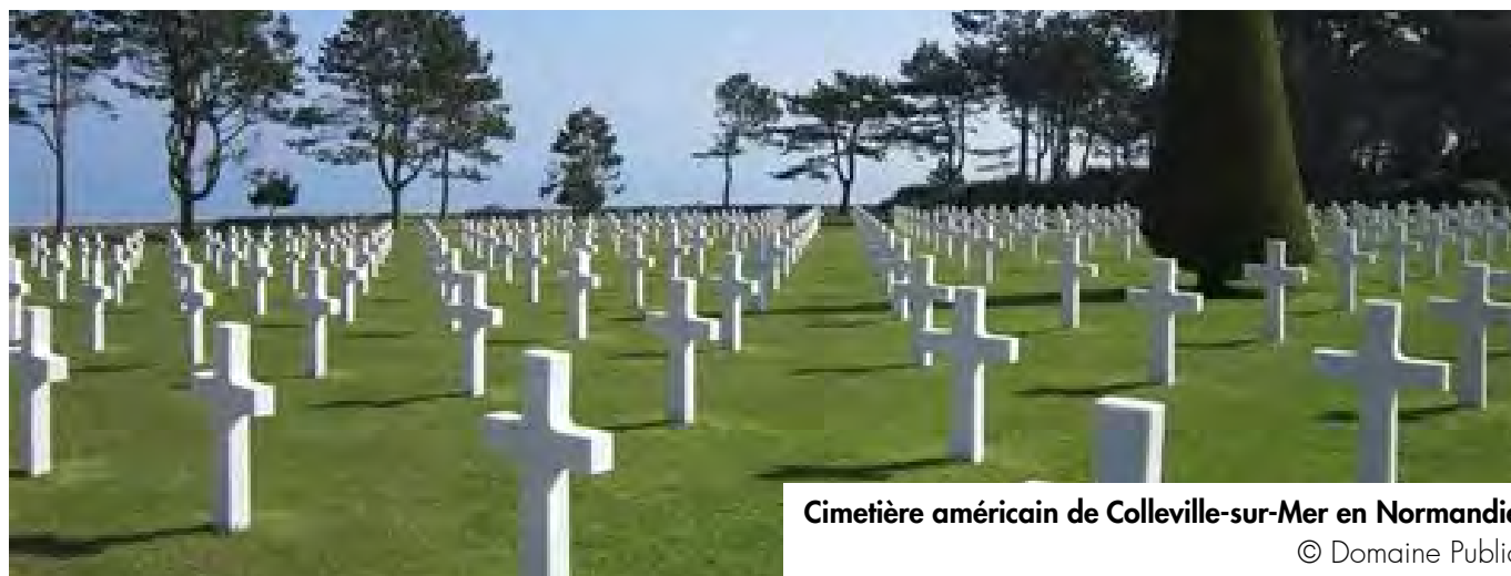
Cimetière américain de Colleville-sur-Mer en Normandie