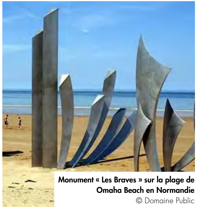
Monument « Les Braves » sur la plage de Omaha Beach en Normandie

Au delà des dates et des événements historiques, cet échange en Normandie a permis aux élèves d'appréhender la dimension humaine et individuelle de l'histoire de la Seconde Guerre mondiale.