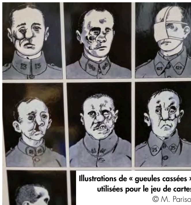
Illustrations de « gueules cassées » utilisées pour le jeu de cartes

Au cœur du projet, se trouve la création du jeu de cartes « La tranchée silencieuse », inspiré par le célèbre jeu « Les Loups-garous de Thiercelieux », afin d'aborder de façon ludique la Grande Guerre. Les élèves ont imaginé des personnages emblématiques de la guerre (poilus, marraines de guerre, brancardier...) et ont rédigé leurs biographies après des recherches au centre de documentation et d'information (CDI) et sur des sites internet tel que « Mémoire des Hommes ». Accompagnés par l'artiste Virgile Bastien, ils se sont initiés à l'illustration pour donner vie à leur jeu.