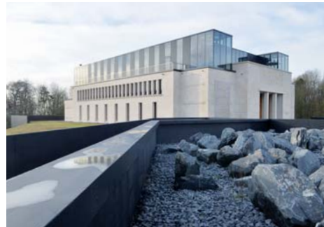
Mémorial de Verdun (Meuse)