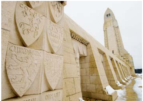
Ossuaire de Douaumont (Meuse)