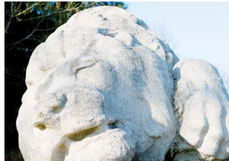
Monument du Lion (Meuse)