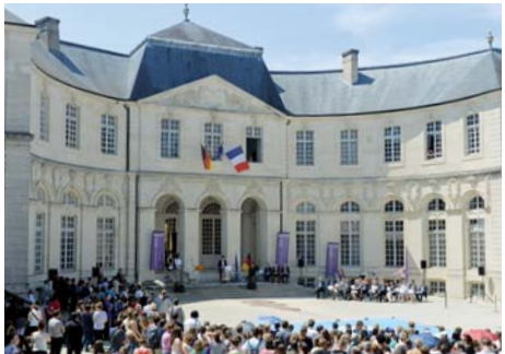
Centre mondial de la paix (Meuse)