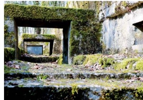
Poste de commandement du colonel Driant (Meuse)