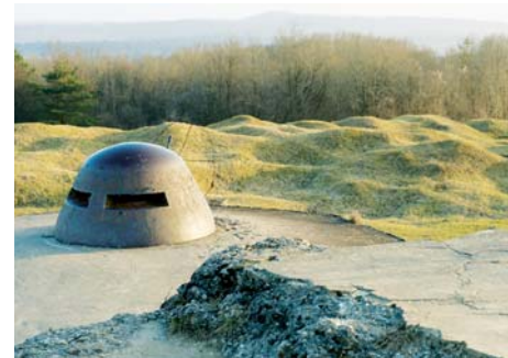
Forts de Vaux et Douaumont (Meuse)