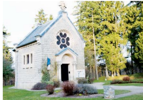
Villages détruits de la Zone Rouge (Meuse)