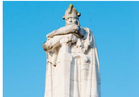
Monument à la victoire (Meuse)