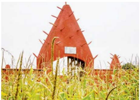
Nécropole nationale du Tata sénégalais (Rhône)