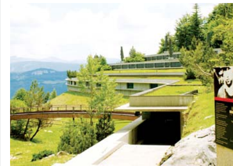
Mémorial de la Résistance en Vercors (Drôme)