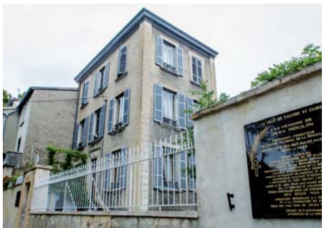
Mémorial Caluire - Jean Moulin (Rhône)