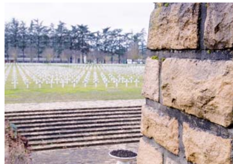
Nécropole nationale de La Doua (Rhône)