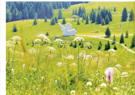
Monument des Glières (Haute-Savoie)