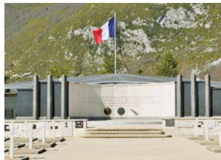
Nécropole nationale de la Résistance (Drôme)