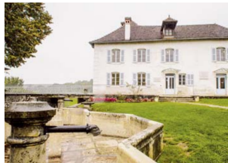
Maison d'Izieu (Ain)