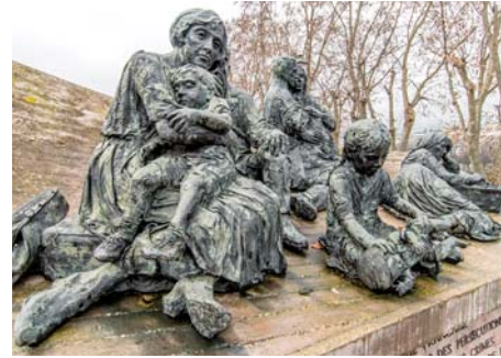
Monument de la rafle du Vél d'Hiv (Paris 15 e )