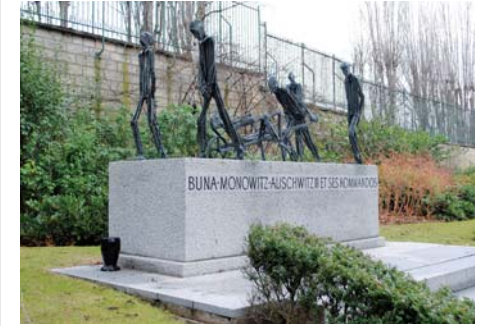
Cimetière du Père Lachaise 97 e division (Paris 20 e )