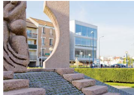
Mémorial de la Shoah (Seine-Saint-Denis)