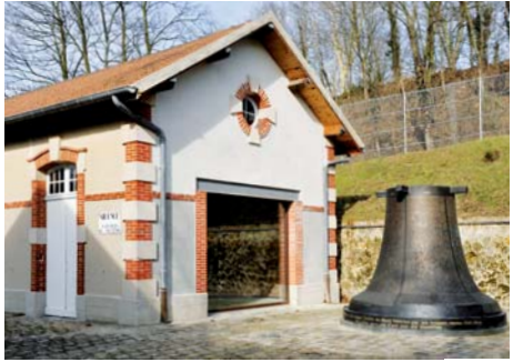
Mémorial du Mont-Valérien à Suresnes (Hauts-de-Seine)