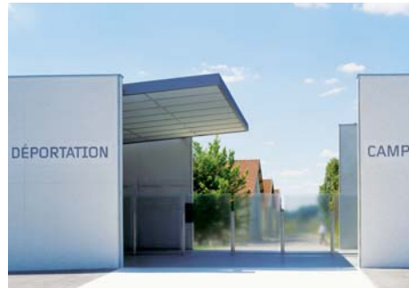
Mémorial de l'internement et de la déportation - Camp de Royallieu (Oise)