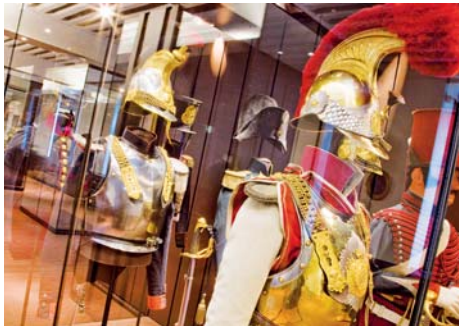
Musée de l'Armée Hôtel national des Invalides (Paris 7°)