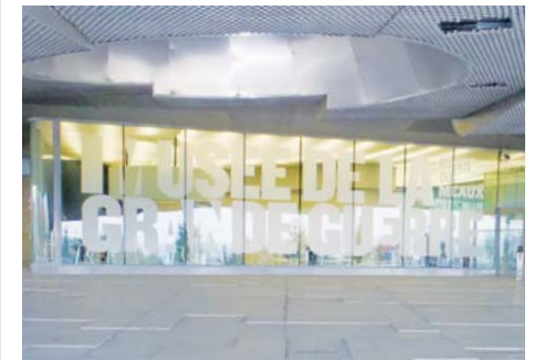
Musée de la Grande Guerre (Seine-et-Marne)