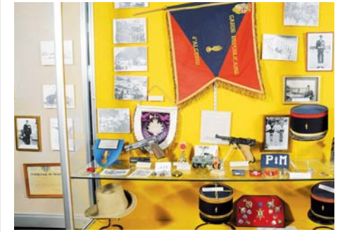
Musée de la Gendarmerie nationale (Seine-et-Marne)