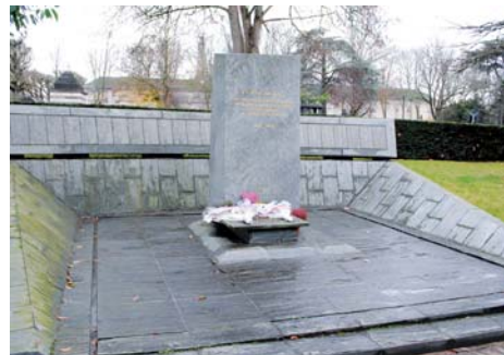
Cimetière du Père Lachaise - Monument Afrique du Nord 1952-1962 (Paris 20°)