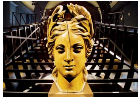
Musée national de la Marine Place du Trocadéro (Paris 16°)