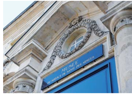
Musée du service de santé des armées Val-de-Grâce (Paris 5°)