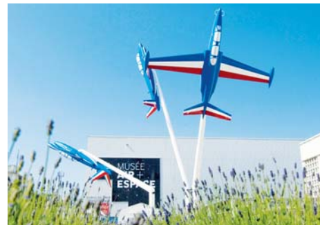
Musée de l'Air et de l'Espace (Seine-Saint-Denis)