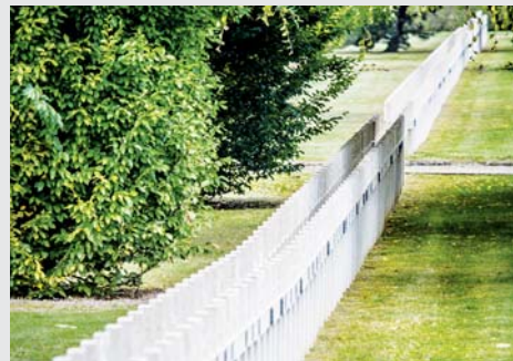
Verdun - Le Faubourg Pavé (Meuse)