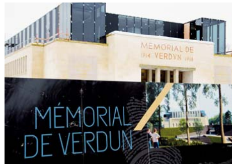
Mémorial de Verdun (Meuse)