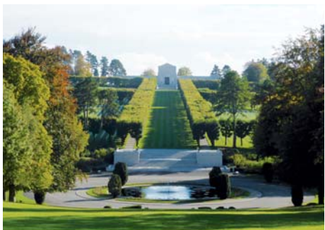
Cimetière américain de Romagne-sous-Montfaucon (Meuse)

LA LIGNE DE FRONT > DE L'ARGONNE À SAINT-MIHEL