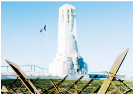
Butte de Vauquois (Meuse)