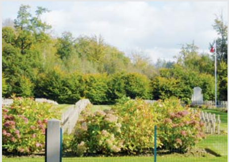
Lachalade - La Forestière (Meuse)