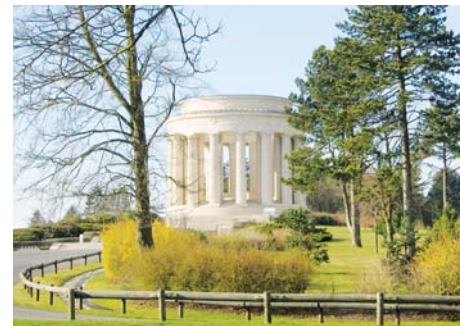
Mémorial américain de la Butte de Montsec (Meuse)