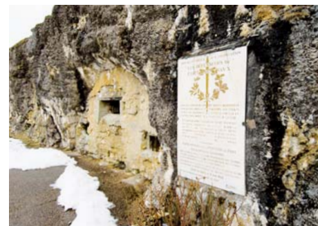
Forts de Vaux et de Douaumont (Meuse)