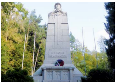
Monument ossuaire de la Haute Chevauchée (Meuse)