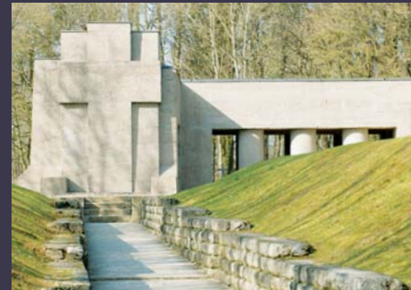
Tranchée des baïonnettes (Meuse)