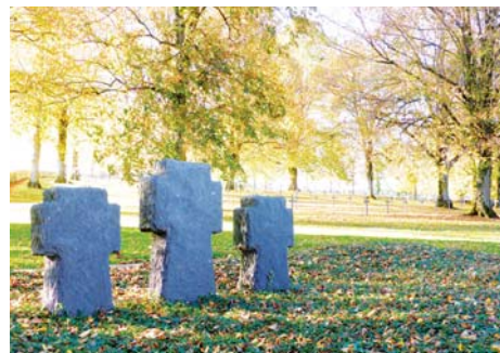
Cimetière allemand de Briulles-sur-Meuse (Meuse)