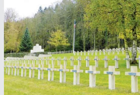
Les Éparges - Le Trottoir (Meuse)