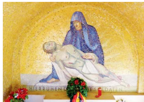
Cimetière allemand de Romagne-sous-Montfaucon (Meuse)