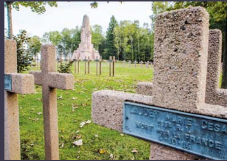
Ban-de-Sapt - La Fontenelle (Vosges)