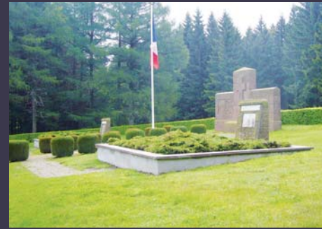
Grandfontaine - Le Donon (Bas-Rhin)