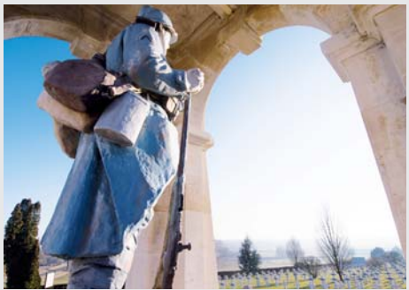
Vitrimont - Friscati Mouton Noir (Meurthe-et-Moselle)