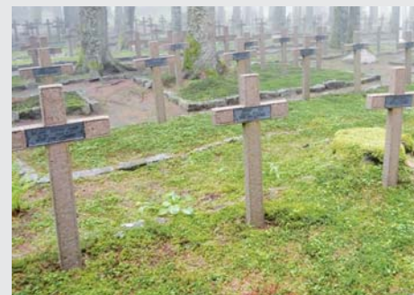
Orbey - Carrefour Duchesne (Haut-Rhin)