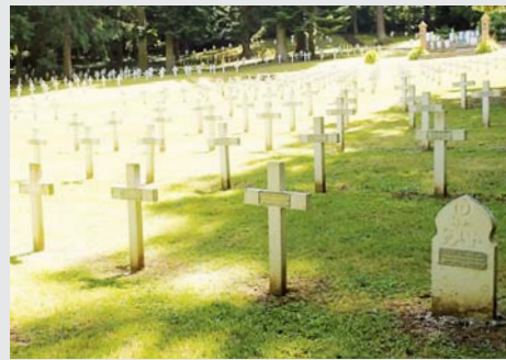
Guebwiller - Waldmatt (Haut-Rhin)