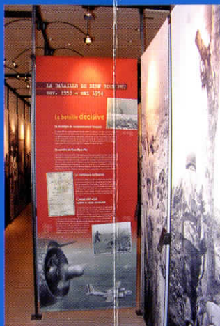
L'exposition « L'Indochine française, 1858-1954 ».

Carré de terre de 2 mètres sur 2 limité par des pierres, recouvert de gravillons blancs avec une stèle centrale surmontée d'une plaque avec inscription : « Ici ont été dispersées les cendres d'anciens combattants d'Indochine qui ont souhaité reposer près de leurs camarades Morts pour la France au cours des guerres d'Indochine ».