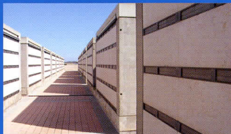
Les rangs d'alvéoles du cimetière militaire national.

Les cimetières nationaux sont réservés aux militaires. Toutefois, 3 539 civils identifiés et 79 inconnus, qui étaient enterrés à côté des militaires dans les cimetières indochinois, sont inhumés à titre exceptionnel sur le site.