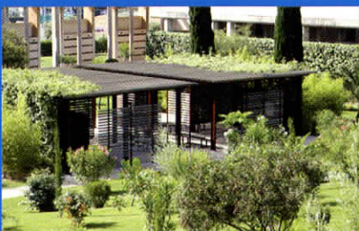
Le lieu culturel.