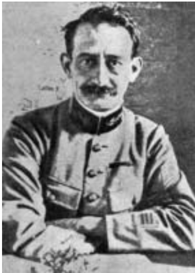
Le commandant Doumenc en 1918.

Joseph Doumenc (Grenoble 16 novembre 1880 – Massif du Pelvoux 21 juillet 1948) :