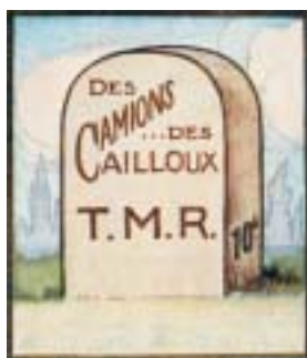
La borne, TMR 709.