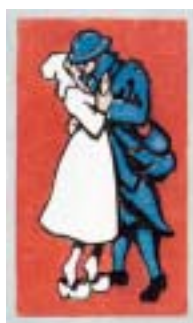
Le retour du convalescent, SS 141.