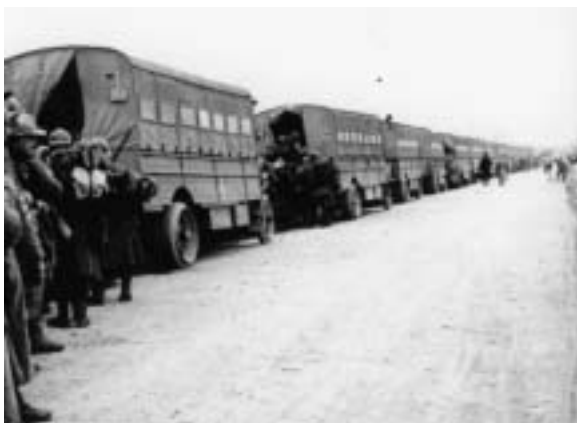
Soldats revenant du combat embarquant à bord de camions.

En 1914, la place de Verdun ne dispose que de 26 camions et 15 voitures automobiles dont une ambulance. 7 sections automobiles pour le ravitaillement en vivres et en munitions des troupes de couverture viennent compléter ce parc à la mobilisation. En 1915, les véhicules disponibles sont de 31 camions, 3 tracteurs à vapeur avec 10 remorques, 18 autobus aménagés et 38 voitures dont 14 sanitaires. En 1916, le parc total est de plus de 9 000 véhicules : 3 500 camions du service automobile, quelque 2 000 véhicules de tourisme, 800 véhicules sanitaires, 200 autobus RVF (ravitaillement en viande fraîche) ainsi que toutes sortes de véhicules de service (courrier, génie, artillerie, camions-projecteurs, autocanons...).