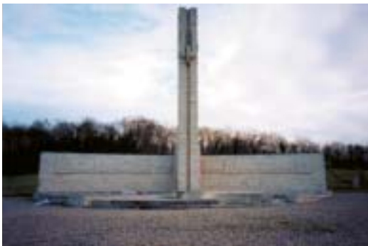
Monument dédié au Train des Équipages militaires, Nixéville, à 10 km au sud-ouest de Verdun.

Ministère de la défense Secrétariat général pour l'administration Direction de la mémoire, du patrimoine et des archives 14, rue Saint-Dominique 00450 ARMÉES