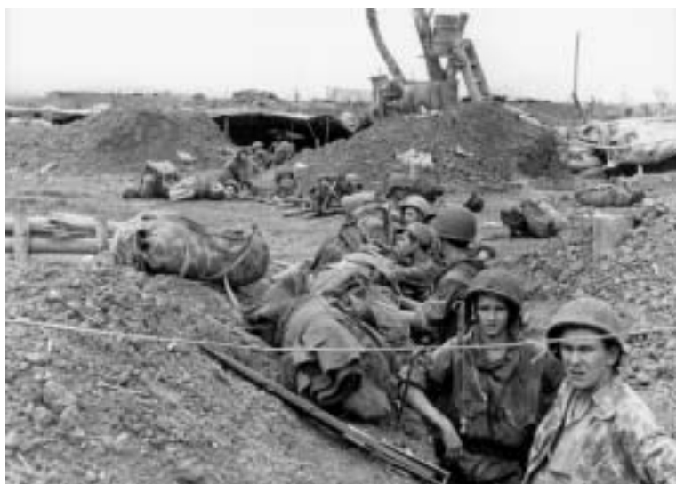
Camp de Dien Bien Phu, parachutistes français dans une tranchée.

Prenant position sur les hauteurs, le Viêt-minh accroît progressivement sa pression sur la garnison française. Alors que toutes les tentatives de désengorgement de Dien Bien Phu par des colonnes de secours échouent, le ravitaillement du camp retranché est rendu de plus en plus difficile par l'intervention permanente de l'artillerie antiaérienne ennemie.