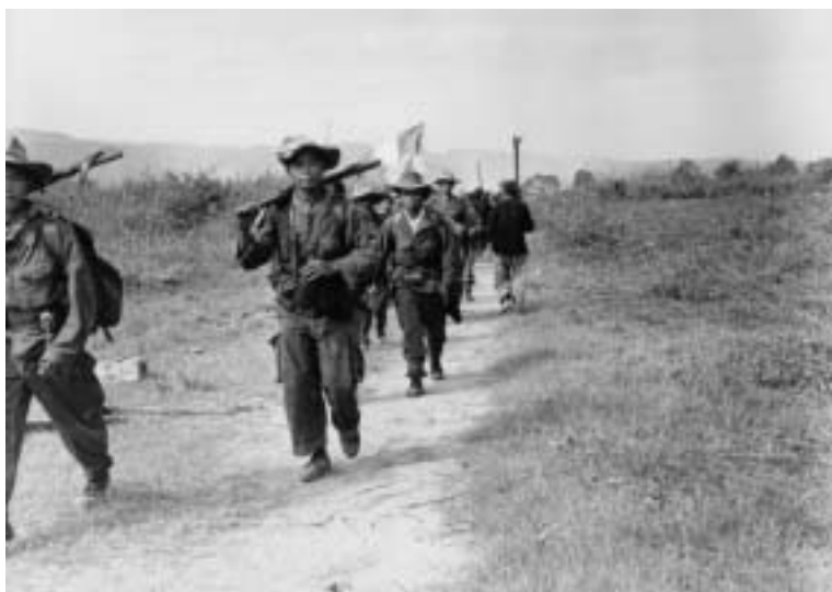
Unité thaïe prenant position.

Tout au long de la bataille, chacun des adversaires ne cesse d'étoffer ses forces, en hommes et en matériels. Si, grâce aux parachutages, les