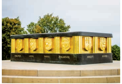
Monument national de l'Hartmannswillerkopf (Haut-Rhin)