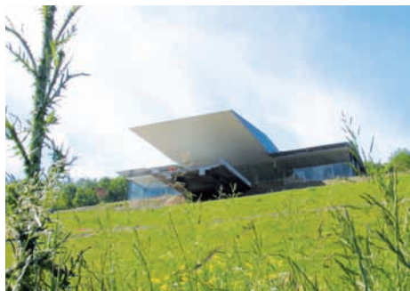
Mémorial de l'Alsace-Moselle (Bas-Rhin)