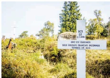
Musée - Mémorial du Linge (Haut-Rhin)