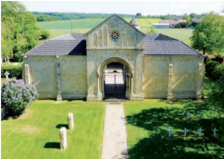
Cimetière militaire 1870-1871 (Moselle)