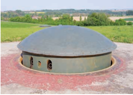
Fort de Schoenenbourg (Bas-Rhin)