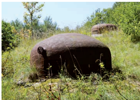
Ouvrage du Simserhof (Moselle)