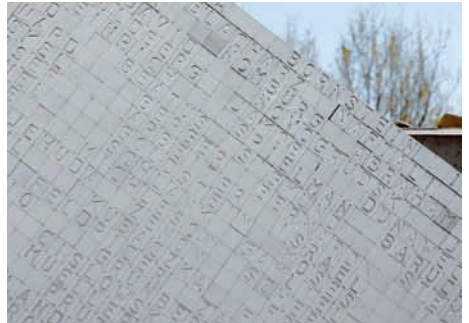
Mémorial camp annexe KZ-Hailfingen Tailfingen (Allemagne)