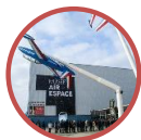
Musée de l'Air et de l'Espace