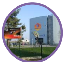
Musée des Transmissions