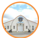
Musée du Matériel et de la Maintenance