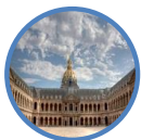
Musée de l'Armée

16 musées du ministère de la Défense, lieux de culture et de patrimoine dans toute la France