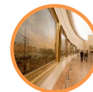
Musée national de la Marine