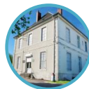
Musée du Train et des Équipages militaires