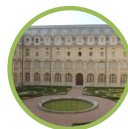
Musée du Service de santé des armées