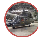
Musée de l'ALAT et de l'hélicoptère