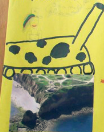
La pointe du Hoc vue de haut