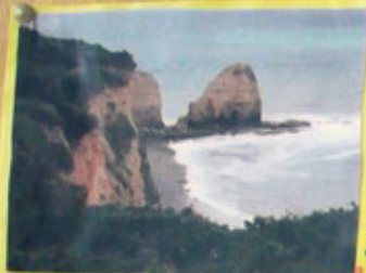
La pointe du Hoc