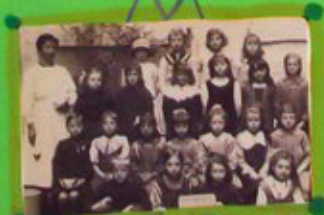
Photo de classe

Nombre d'enfants victimes des conflits. - En Syrie : 1400 enfants - Au Mali : 25000 enfants - En République Démocratique du Congo : 10000 enfants - En côte d'Ivoire : 1000 enfants.