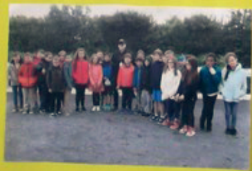
On a remémoré en vidéo l'opération à Kitzbühel en 1944