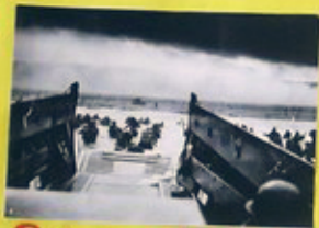
Photos de soldats débarquant sur les plages de Normandie